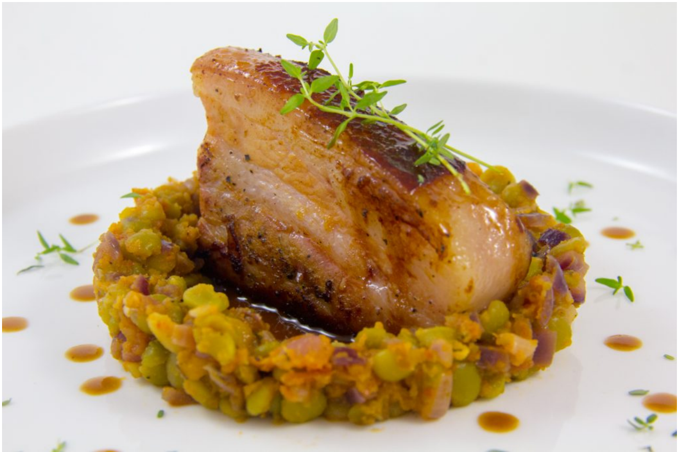
Lard confit basse température et son petit jus, pois cassés au thym