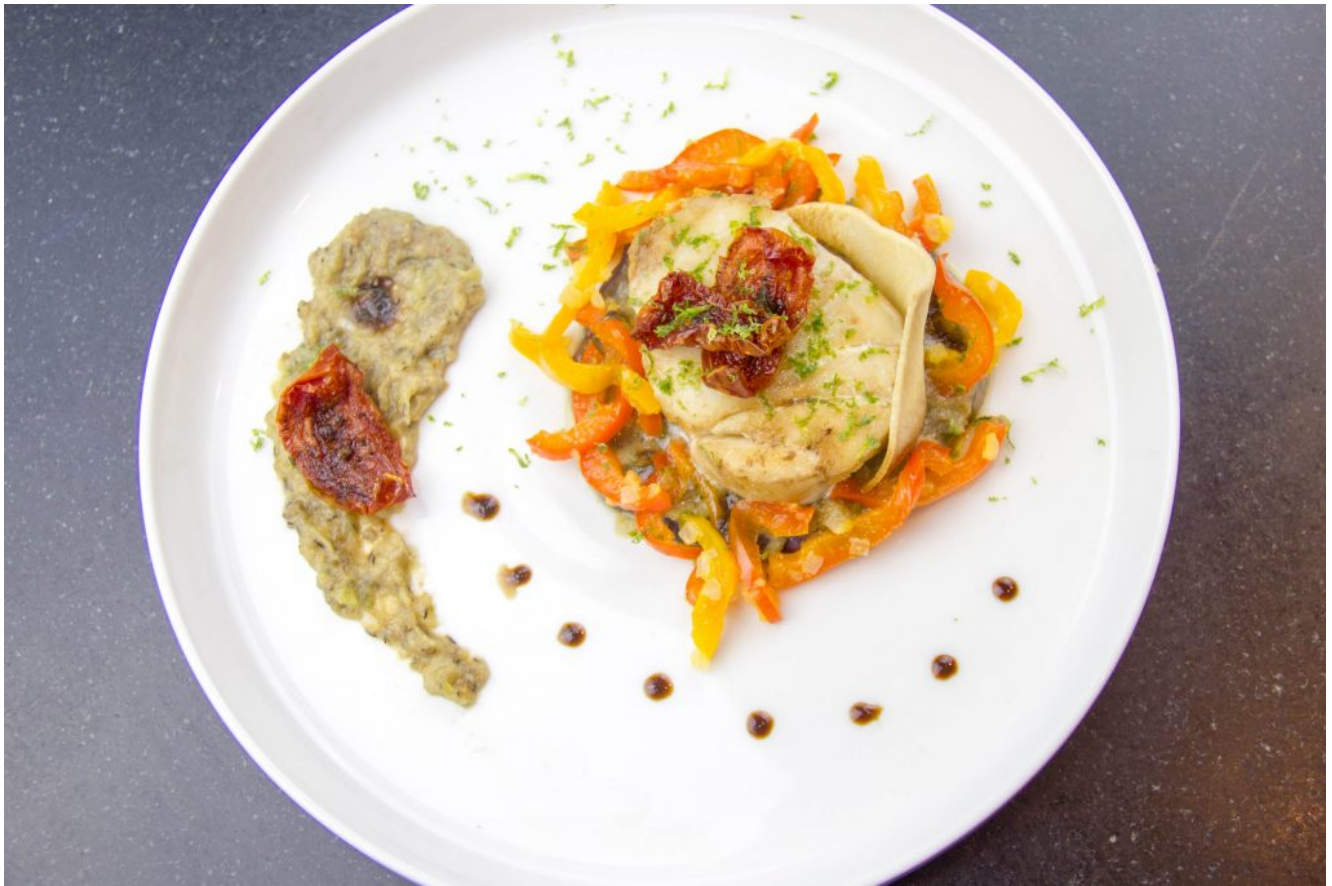
Tournedos de cabillaud au gingembre et sa poêlée de poivrons, aubergines en deux façons