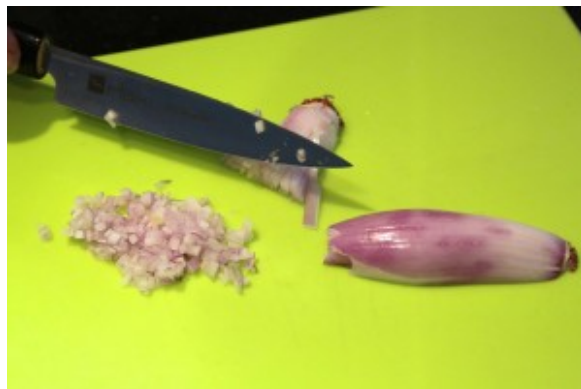
Taillez l'échalote en tous petits dés