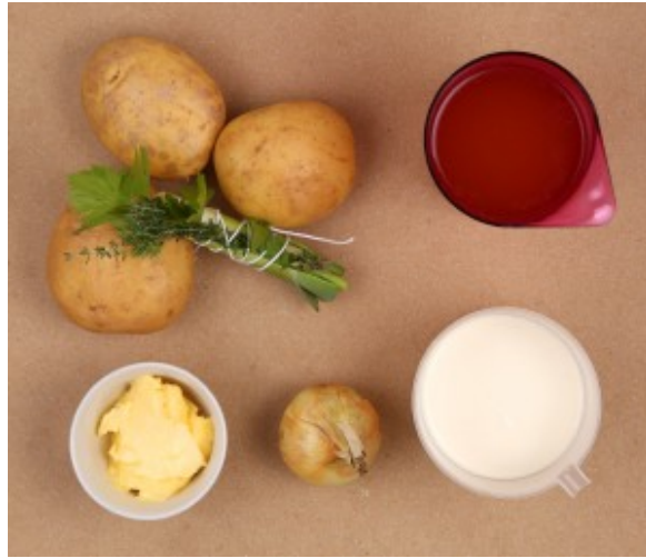
crèmeux de pommes de terre: ingrédients