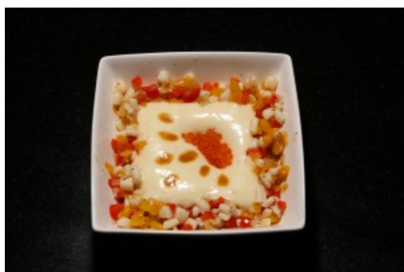
Méli mélo de calmar, mousse légère de pommes de terre aux œufs de saumon

Pour plus de précisions sur la technique et l'utilisation du siphon cliquer ici .