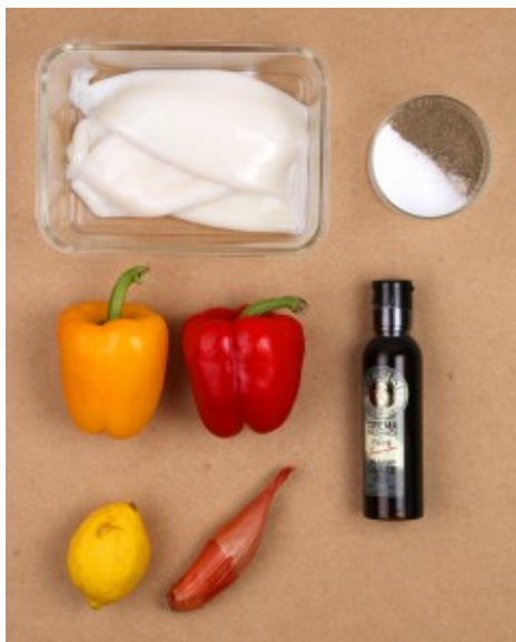
méli mélo de calmar: ingrédients