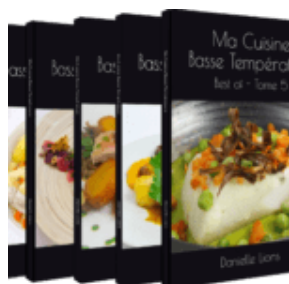
Tomes 1, 2, 3, 4, 5

Beaucoup d'entre vous aviez émis le souhait d'être informés de la parution de mes meilleures recettes basse température.