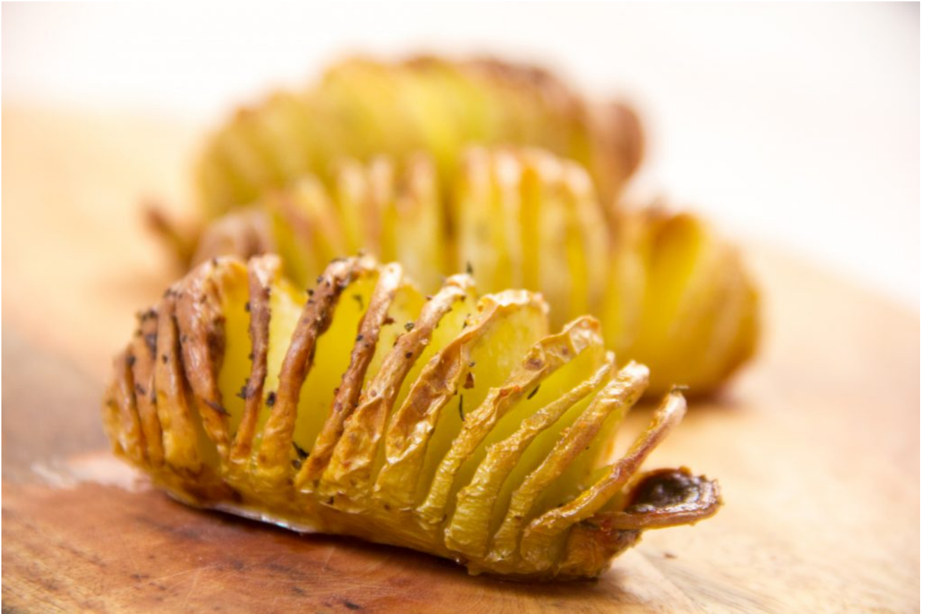
Pommes de terre en éventail