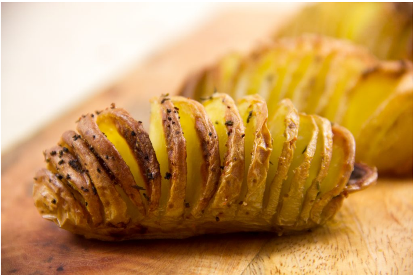
Pommes de terre en éventail