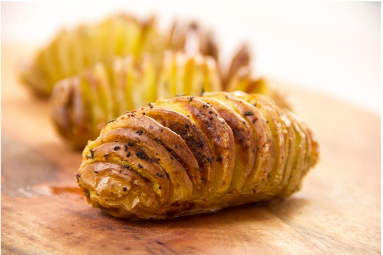
Pommes de terre en éventail

Des pommes de terre ultra faciles à faire, bien croustillantes et super parfumées aux herbes, qui étonneront par leur look élégant? Ne cherchez plus, les voici! Elles accompagneront avec délice vos rôtis mais également toutes vos grillades ou barbecues. Vous pouvez même les préparer à l'avance et les repasser au four pour les réchauffer avant de servir.