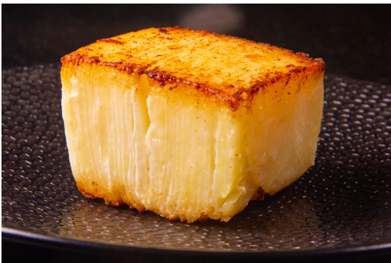
Mille feuille de pomme de terre basse température

Ces petits pavés des pommes de terre sont un véritable régal... Leur structure en mille feuille leur apporte énormément de moelleux et la cuisson sous vide permet une cuisson parfaite. Ce Mille feuille de pomme de terre accompagnera avec gourmandise vos rôtis de viande et se marie particulièrement bien avec l'agneau.