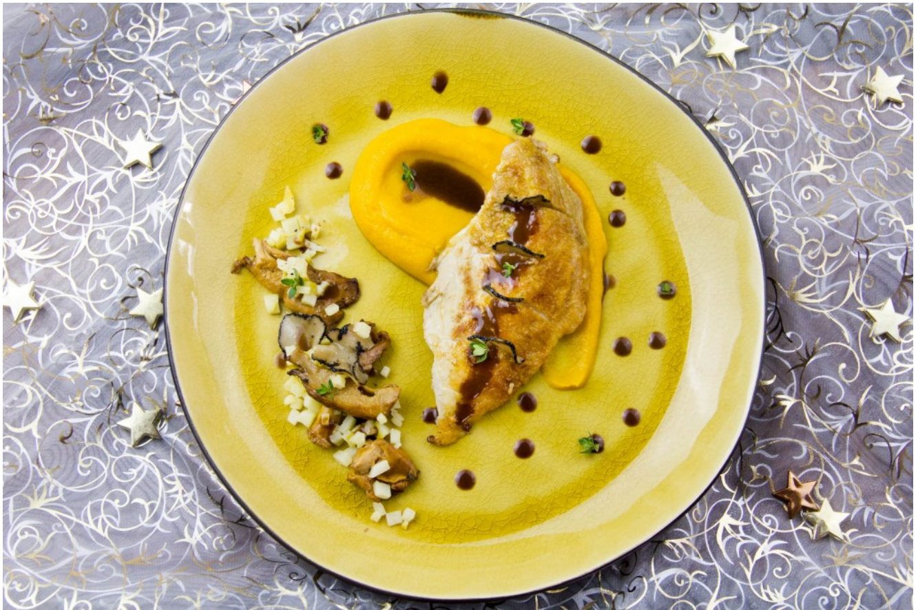
Pintade rôtie aux truffes, carottes, pommes et girolles, sauce chocolatée