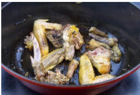
Saisissez les morceaux de carcasse rapidement