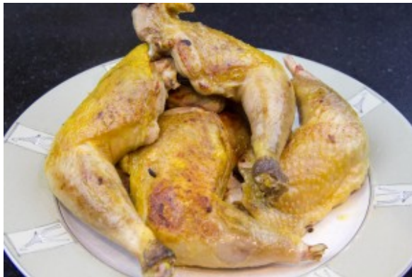
Colorez les cuisses