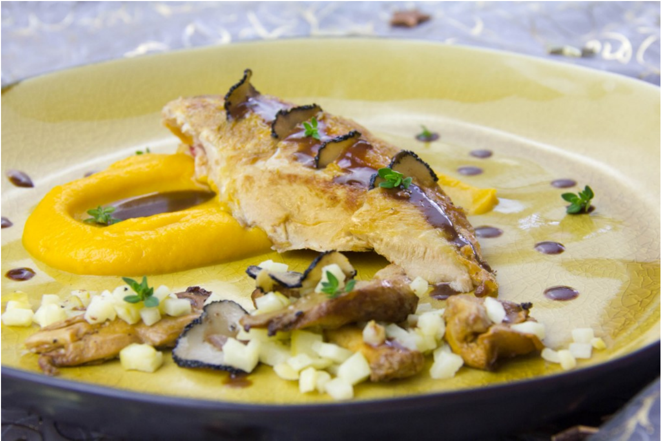
Pintade rôtie aux truffes, carottes, pommes et girolles, sauce chocolatée