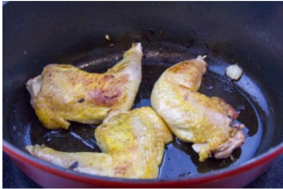
Colorez les cuisses