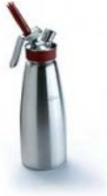
syphon gourmet whip ISI