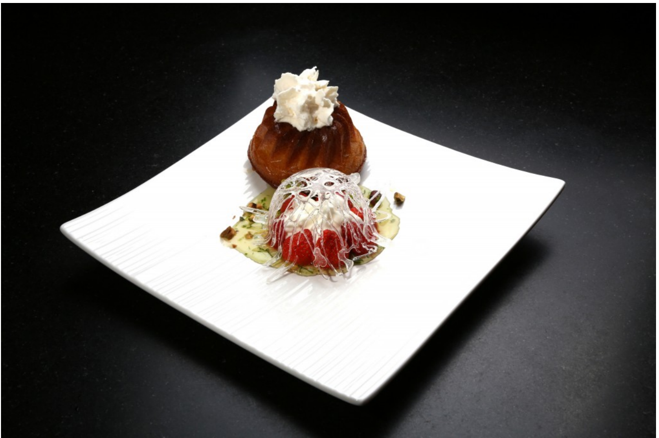
baba au rhum...ou pas

Cliquer ici pour le dessert aux fraises de Naoëlle d'Hainaut