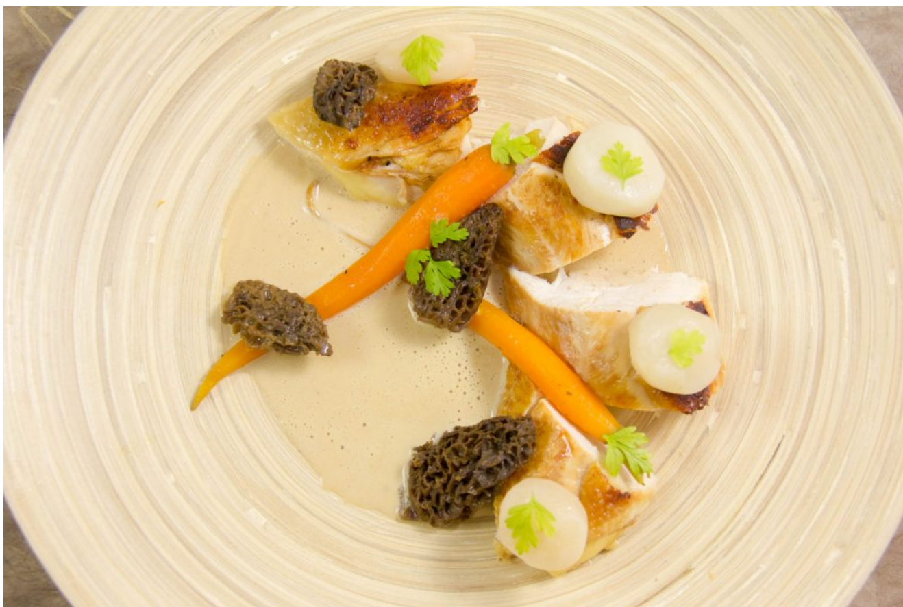
Poulette de Bresse à la crème, basse température au four, façon Georges Blanc

fond de l'assiette et disposez le poulet, les morilles et les légumes de manière harmonieuse. Décorez de quelques pousses de shiso ou de cerfeuil.