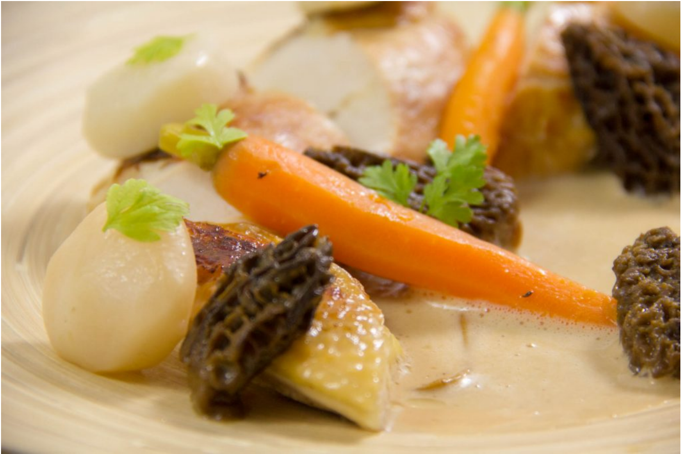
Poularde de Bresse à la crème, basse température au four, façon Georges Blanc