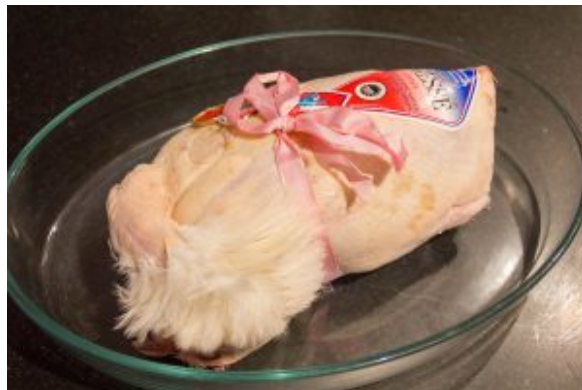
The poulet de Bresse