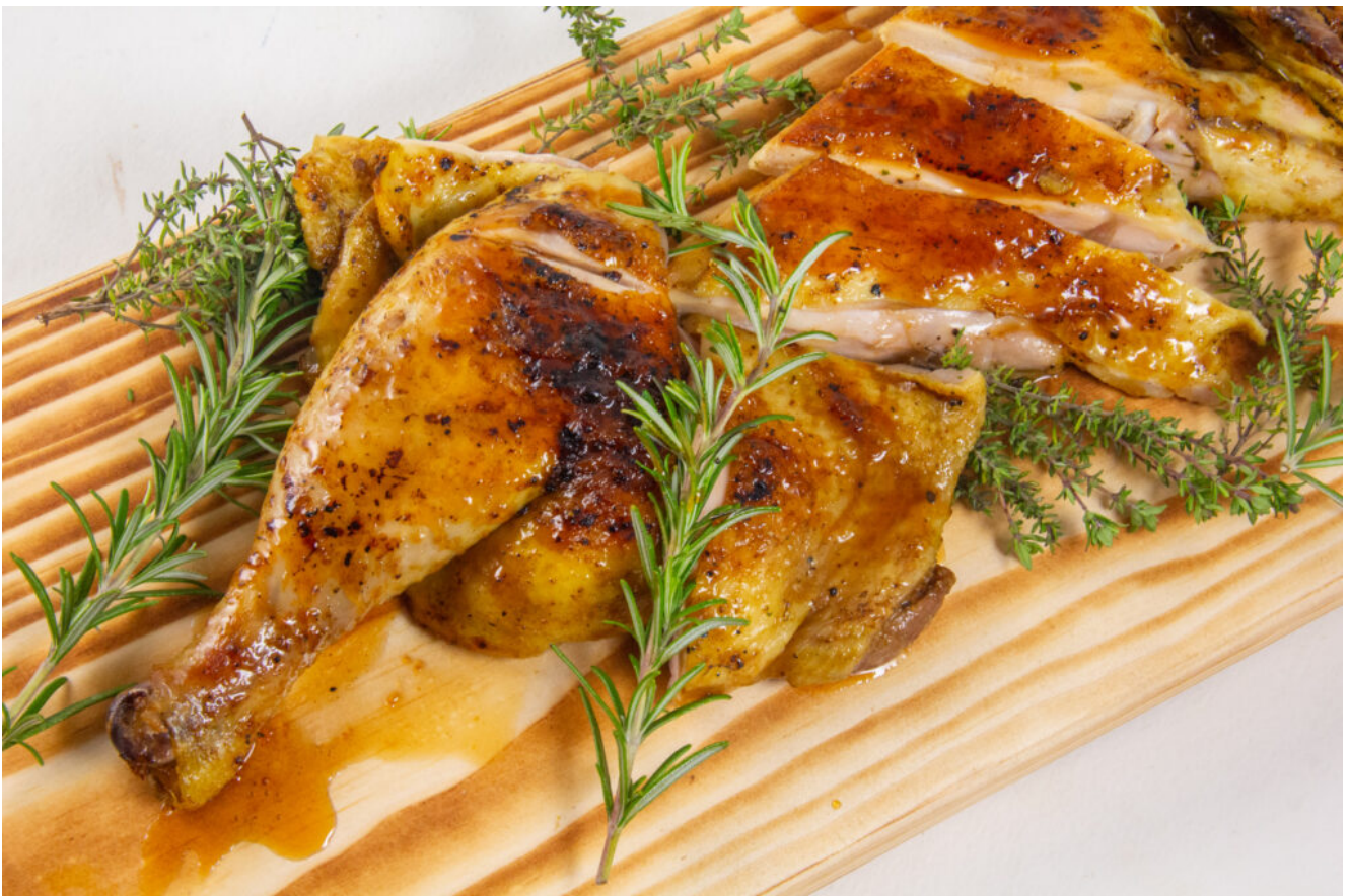
Poulet Paul Payret

Vous devez désosser le poulet: pas de panique vous pouvez soit le demander à votre volailler/ boucher ou le faire vous même en suivant le tutoriel que je vous ai trouvé sur YouTube ( voir vidéo en fin d'article)