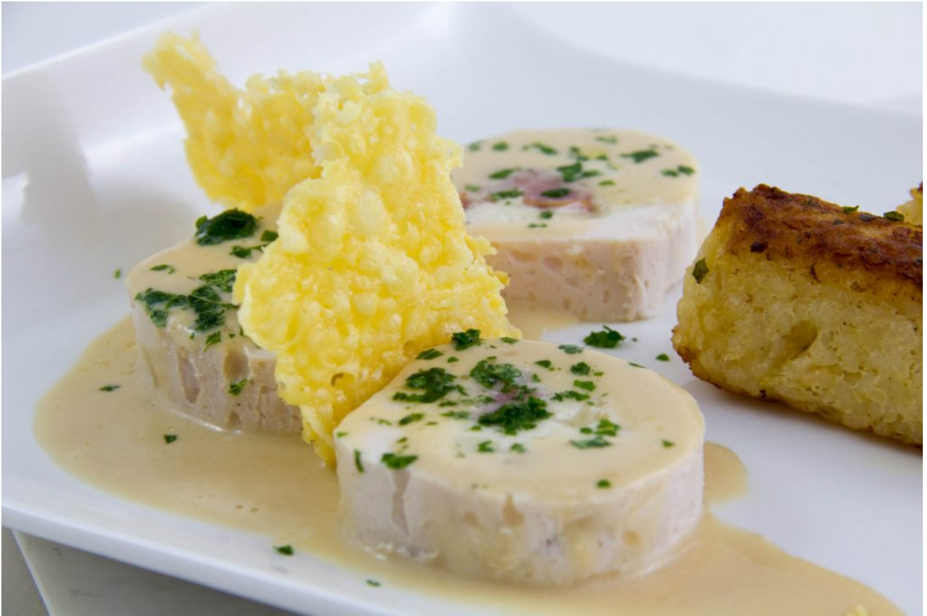
Poulet Franc Comtois de Philippe Etchebest, basse température