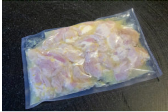
Mettez le poulet sous vide