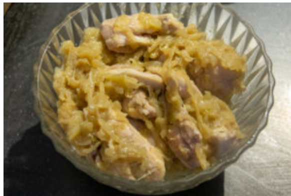
Mélangez poulet et oignons