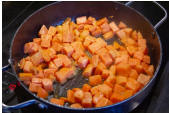
Faites revenir les patates douces