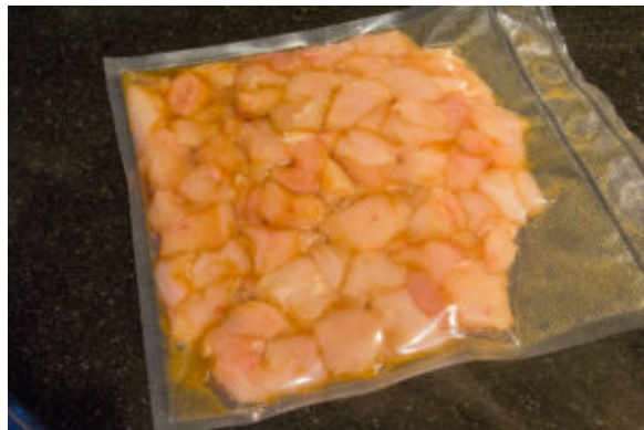
Mettre le poulet sous vide