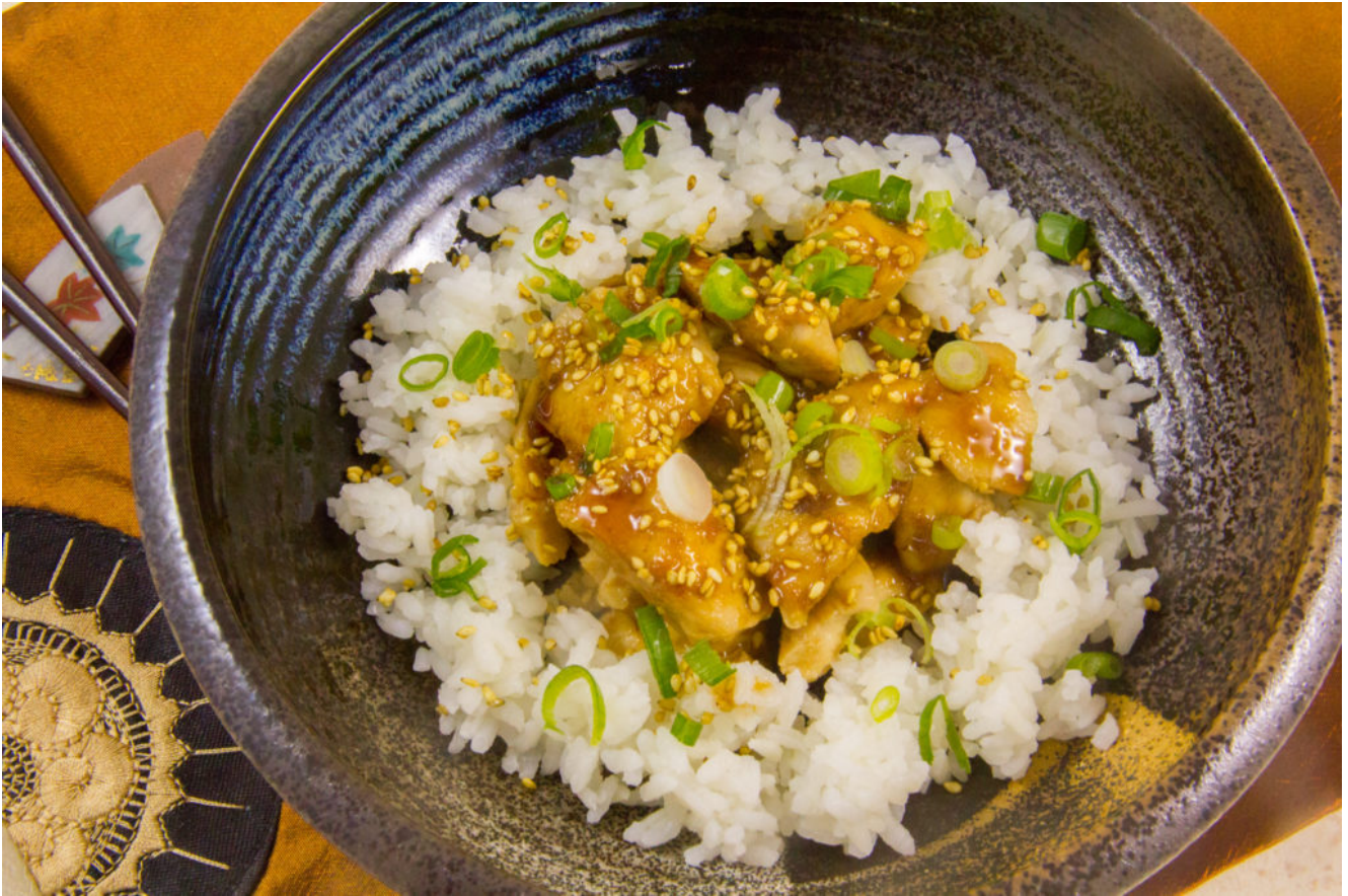
Poulet laqué à la mode japonaise (recette basse température)