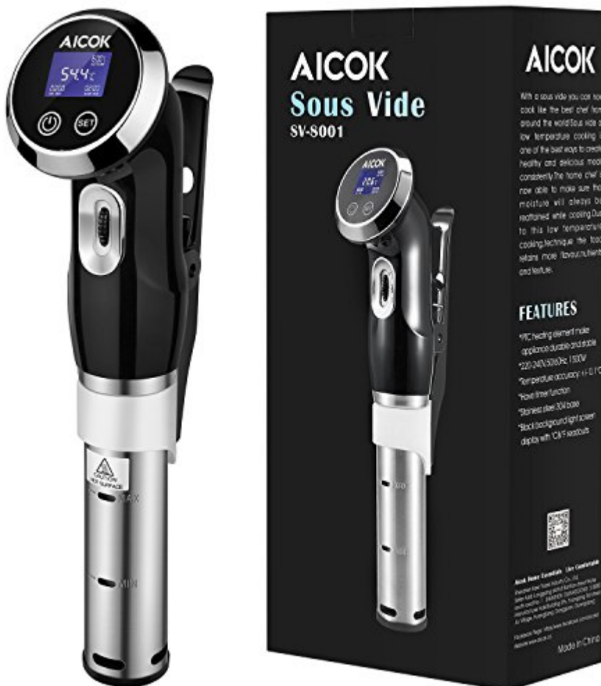
Aicok Cuiseur Sous Vide 1500W Calculateur d'Immersion de