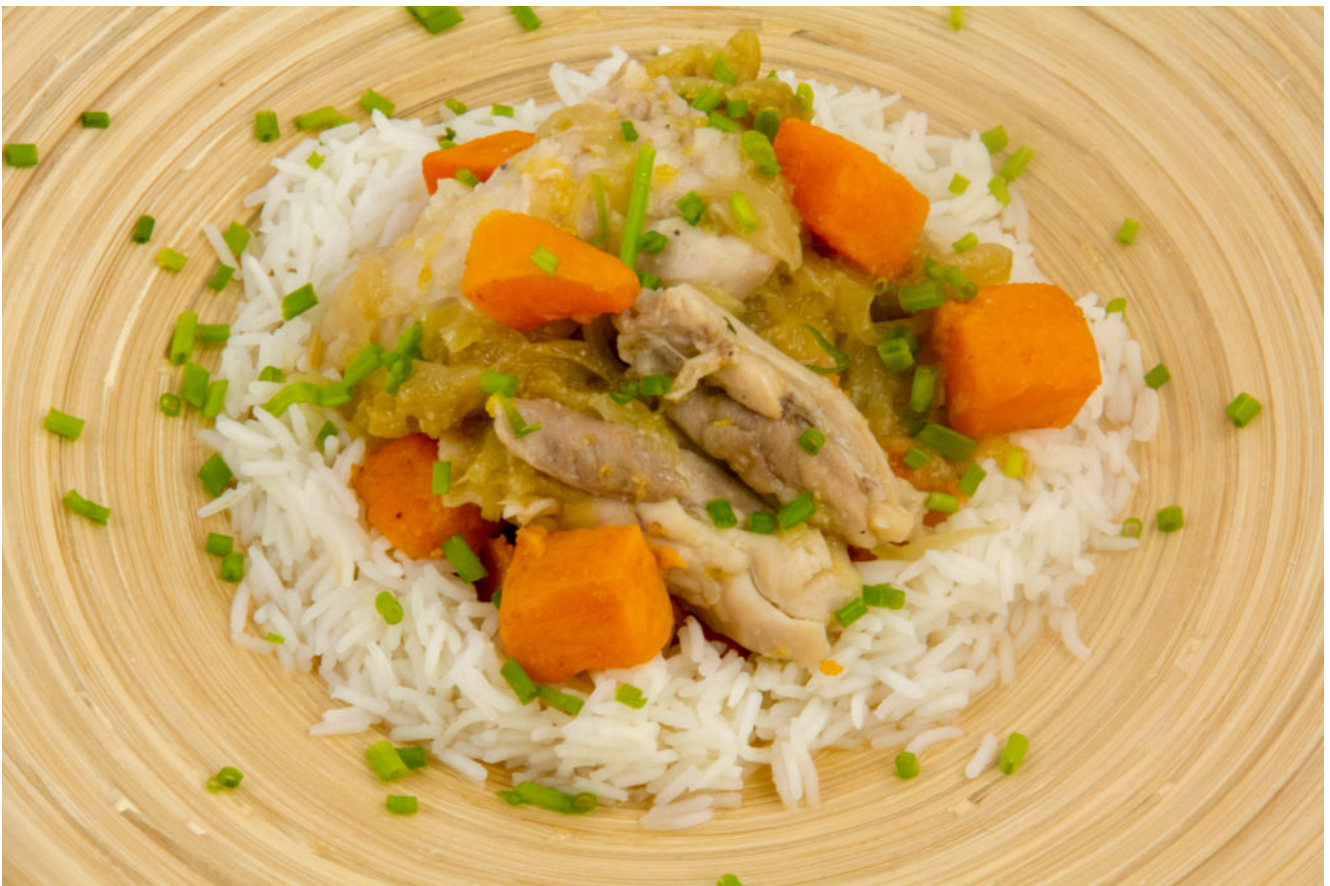
Poulet Yassa (recette basse température)