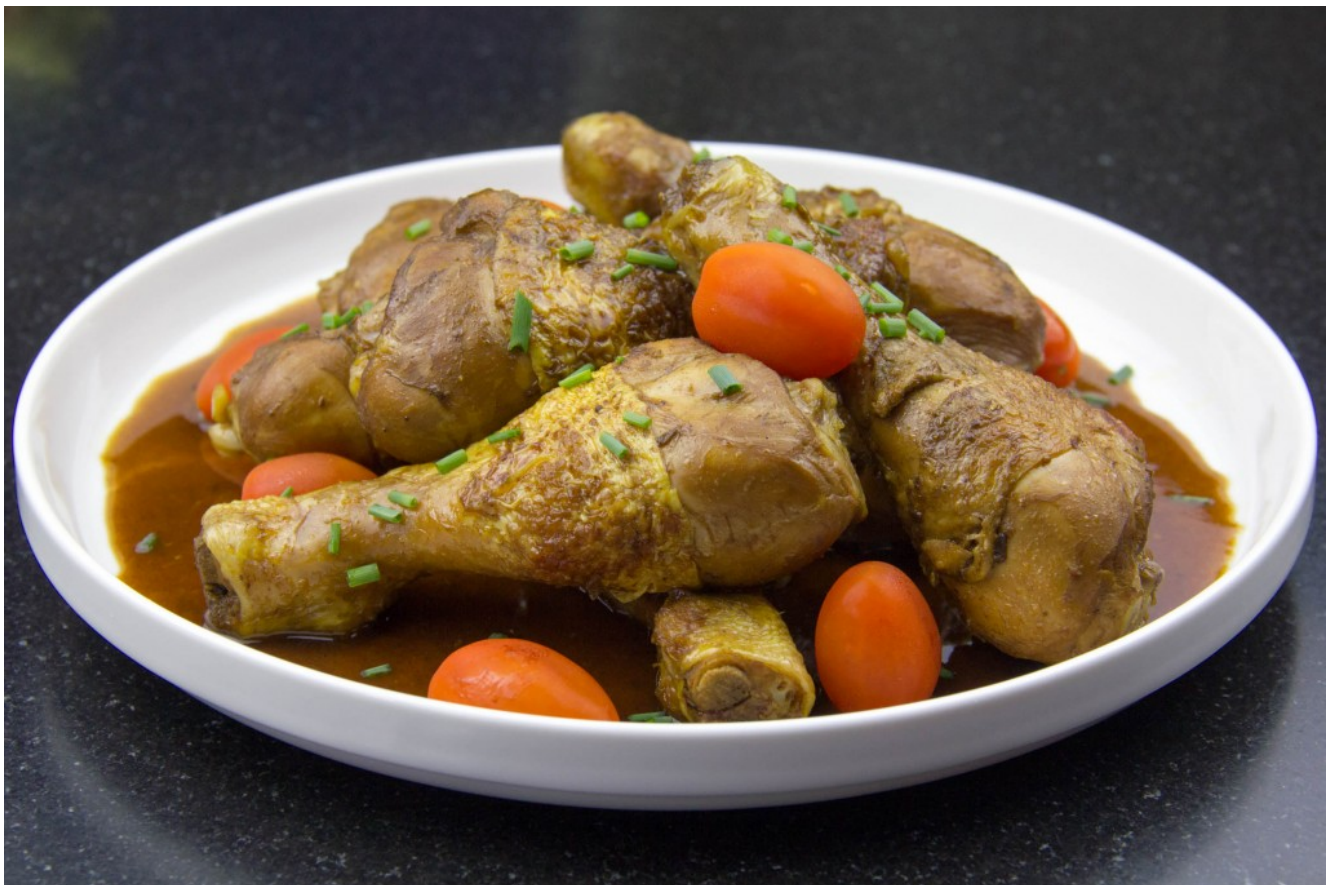
Pilons de poulet au Cola, marinés Tex Mex, basse température

Vos pilon sont prêts à être dégustés! C'est sublime!