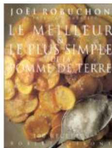
Le meilleur et le plus simple de la pomme de terre

Cette recette est tirée de l'excellent livre « Le meilleur et le plus simple de la pomme de terre » de Joël Robuchon que je vous conseille vivement.