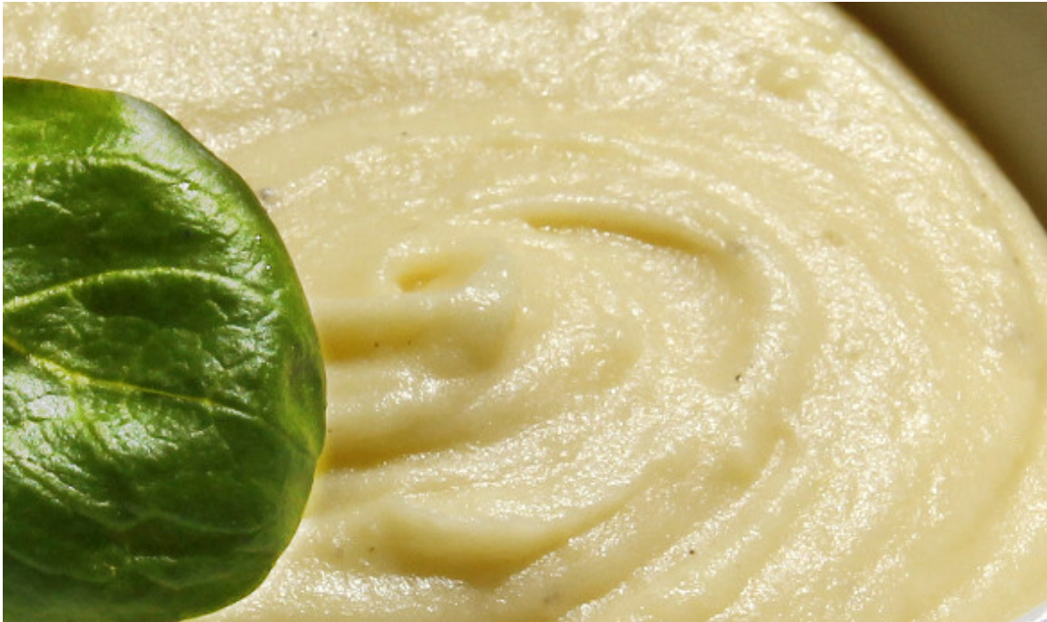
Le nec plus ultra de la purée

Cette recette est tirée de l'excellent livre « Le meilleur et le plus simple de la pomme de terre » de Joël Robuchon que je vous conseille vivement.