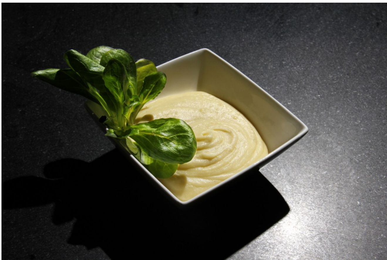
La purée de pommes de terre de Joël Robuchon

Quand vous aurez goûté à cette purée vous comprendrez pourquoi elle a fait le renom d'un de nos plus grands chefs : Joël Robuchon qui de 2000 à 2009 nous a offert la meilleure émission culinaire que nous n'ayons jamais eu à la télévision française...Je n'ai qu'un mot à vous dire: « Bon appétit bien sûr! »