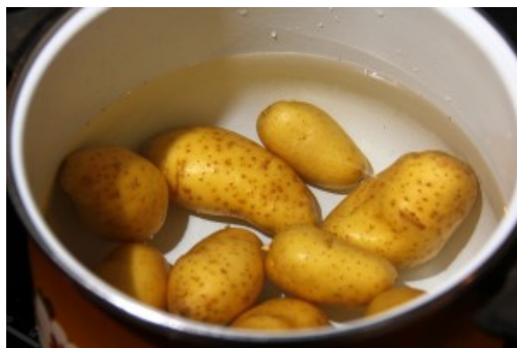
Faire cuire les pommes de terre