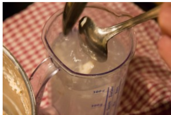
Rincez les cuillères