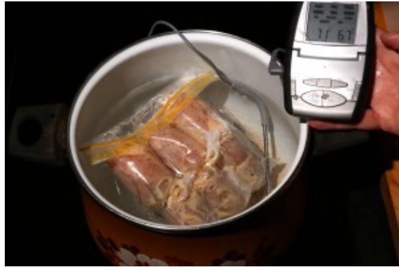
Cuisson du poulet