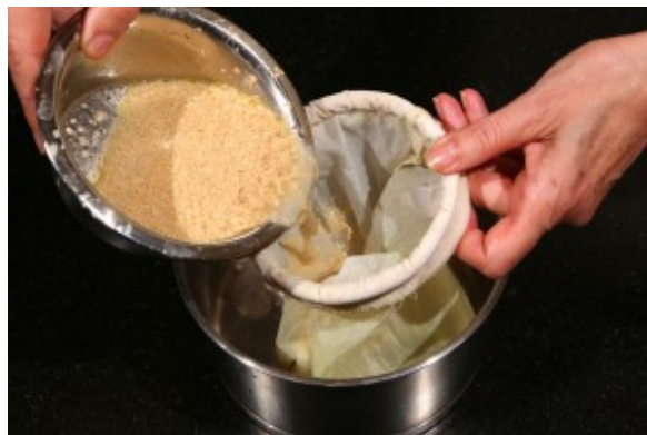
Passez le jus de cuisson du poulet