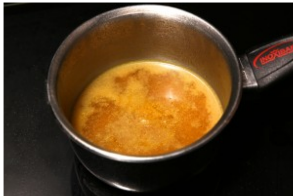
Chauffez le jus du poulet que vous venez de filtrer et faites le réduire des 2/3