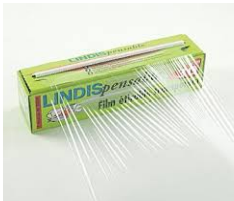
film alimentaire étirable

Ou si vous désirez vous équiper avec le matériel spécifique basse température: