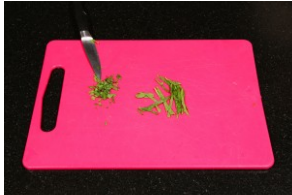
Ciseler la menthe