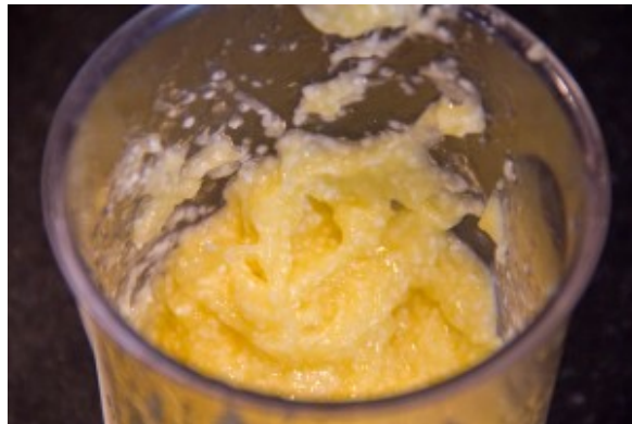
Montez la mayonnaise