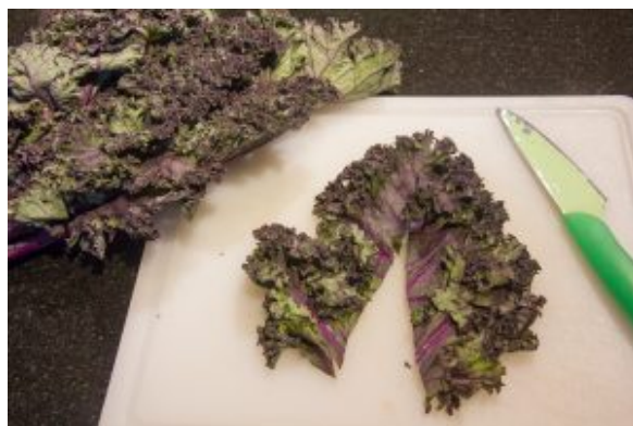
Ôtez la tige centrale de la feuille