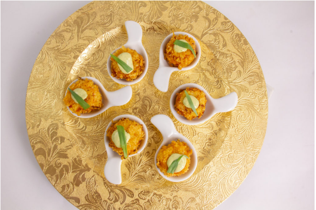
Cromequis de crevette, mayonnaise estragon