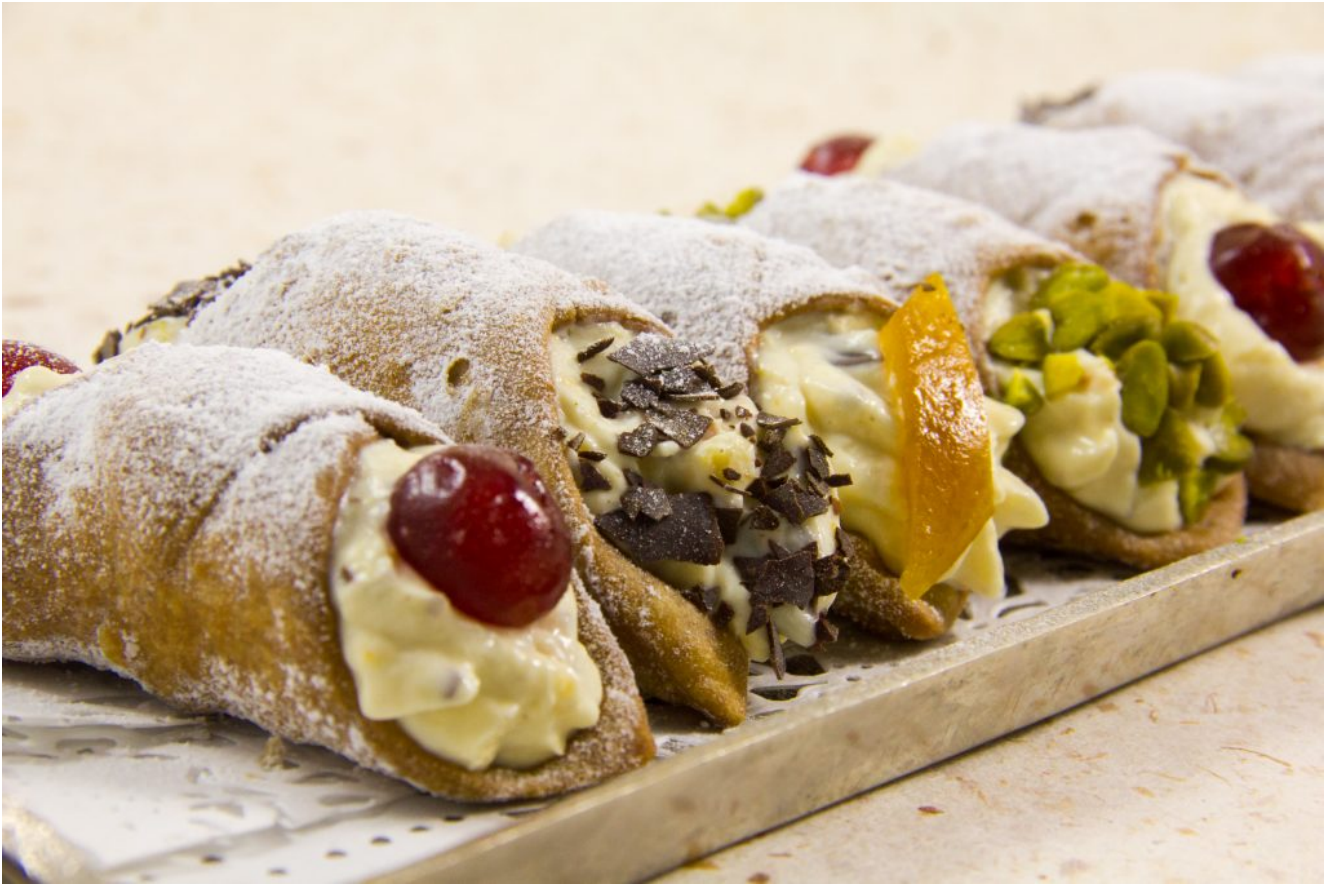
Cannoli (Épreuve de Mercotte, le Meilleur Pâtissier 2017)