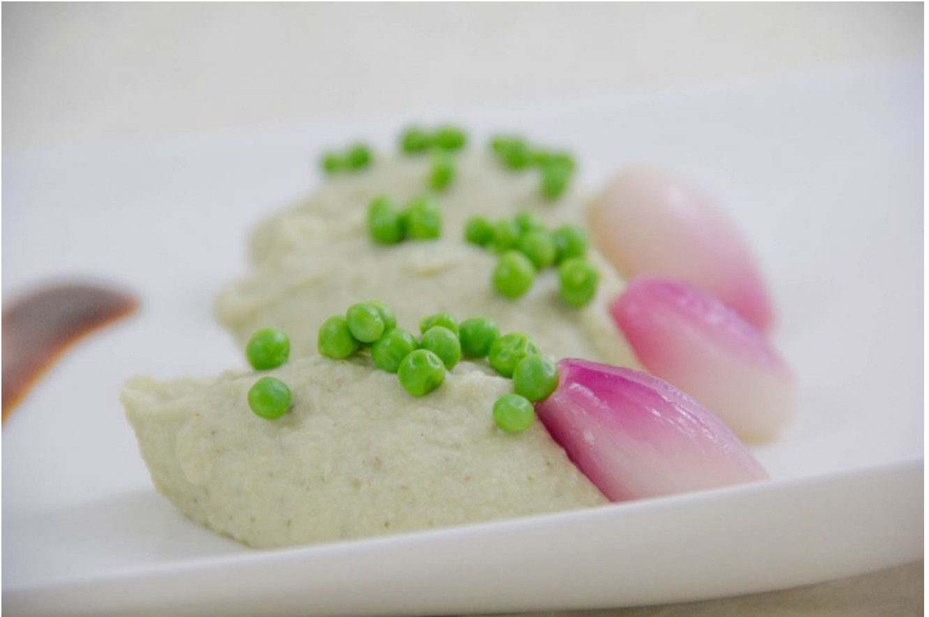
Purée d'artichaut aux petits pois