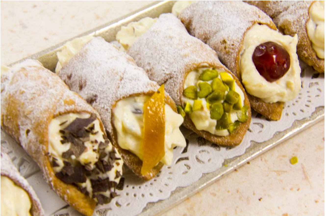
Cannoli (Épreuve de Mercotte, le Meilleur Pâtissier 2017)

Mercotte vous les propose fourrés avec une crème à la pistache et marmelade de fraise. Vous trouverez en fin de page les proportions exactes de sa recette. Mais je vous livre aujourd'hui une recette familiale (mes arrières grands parents étant originaires du Piémont) que je réalise depuis longtemps; le biscuit du cornet est extrêmement croustillant et vous pouvez parfumer la base de la crème avec le parfum que vous désirez. Vous trouverez les proportions pour différentes saveurs. A vous de choisir celle qui titille le mieux vos papilles!