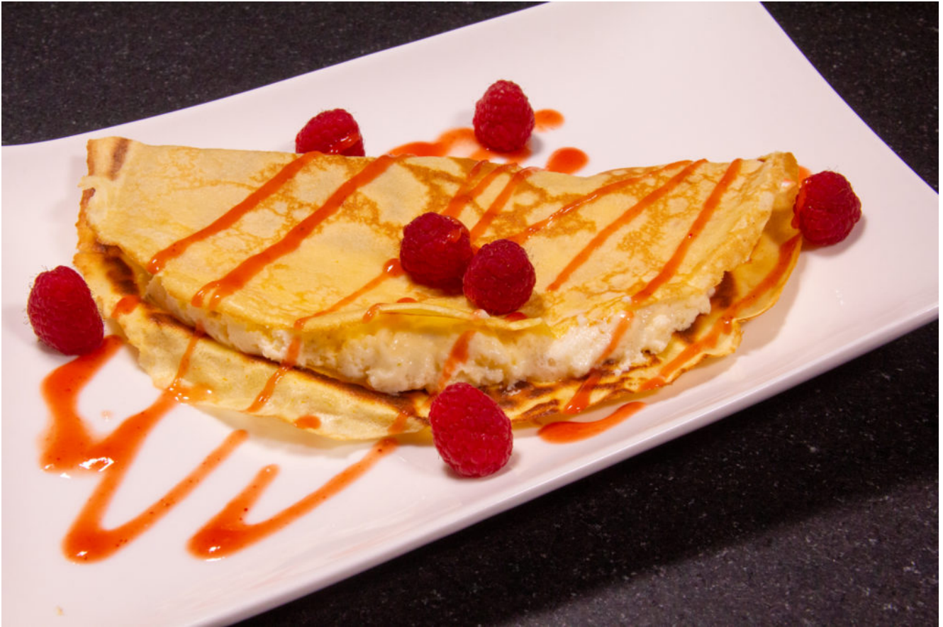
crêpes Thierry Marx