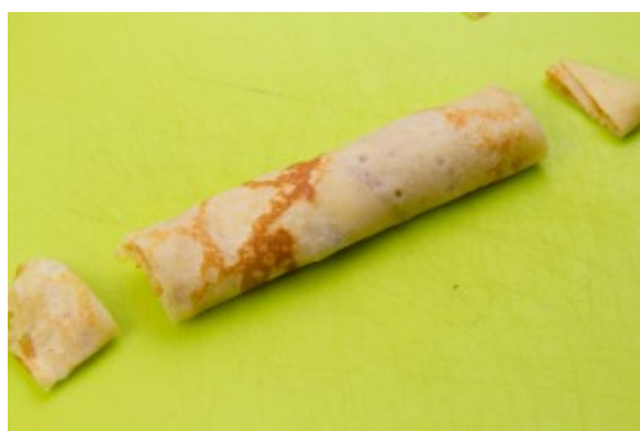
Parez les crêpes