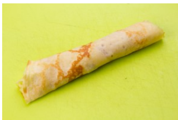
Roulez les crêpes