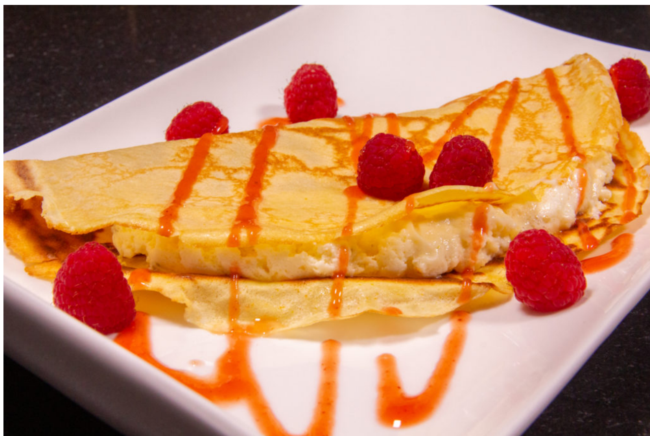
crêpes Thierry Marx

Ce dimanche 2 février c'est la chandeleur! Cette année je vous en propose une version façon grand chef: les crêpes façon Thierry Marx! Je les ai accompagnées avec de la mousse au citron et des framboises...Un petit bonheur de gourmandise!