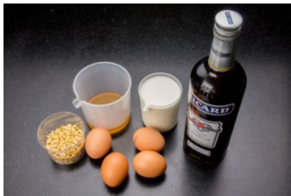
Ingrédients crème Délice