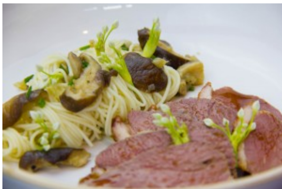
Magrets de canard à la mode japonaise

Il y a quelques semaines je vous avais dévoilé comment réussir à coup sur la cuisson de vos magrets de canard à l'aide d'un mode de cuisson auquel vous n'auriez peut-être pas pensé ( Comment réussir parfaitement la cuisson des magrets de canard ). Aujourd'hui je vous propose une recette complète à base de ces fameux magrets. N'oubliez pas de les préparer la veille pour leur permettre de bien s'imprégner de la marinade.