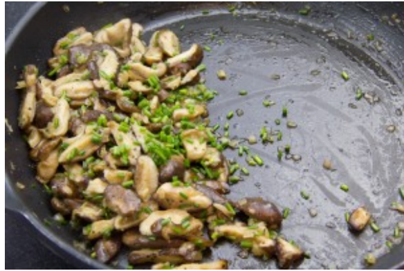
Faire revenir les shitakes avec la ciboulette