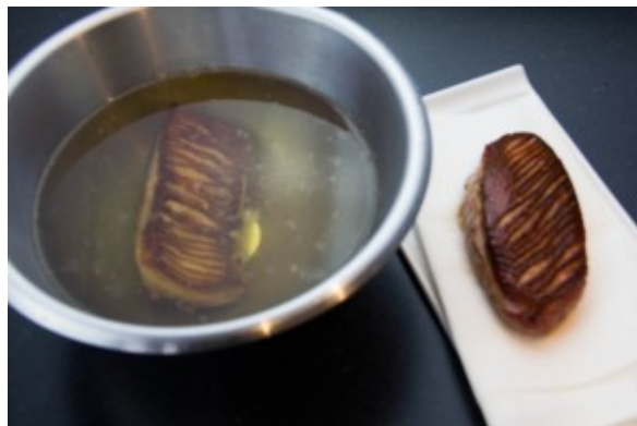
Plongez immédiatement les magrets dans de l'eau bien chaude