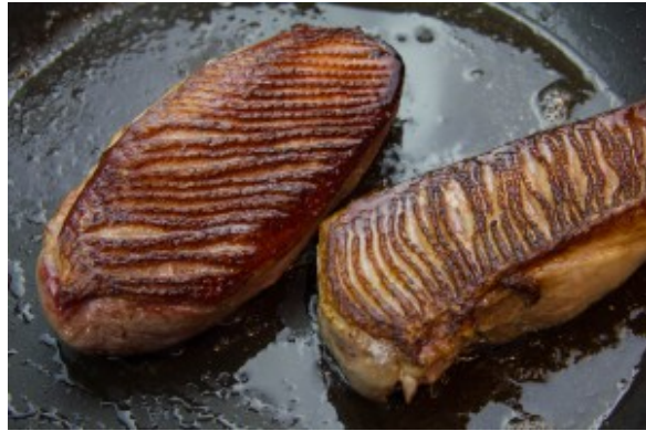
Cuisson parfaite des magrets de canard