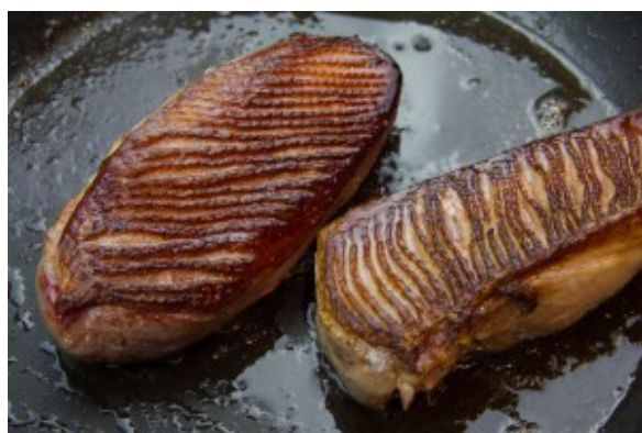
Cuisson parfaite des magrets de canard

De plus vous pouvez préparer ces magrets la veille et les servir froids dans une salade ou chauds en les ramenant à température environ 15 mn dans un four à 55°.