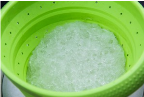
Cuire et égouttez les pâtes japonaises