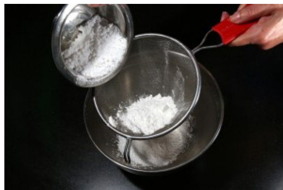
Tamisez le farine