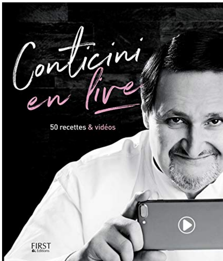
Philippe Conticini en live

Et pour d'autres recettes ultra gourmandes du Chef je vous conseille son livre » Conticini en live ». Pour le commander cliquez sur la photo ci-dessous: