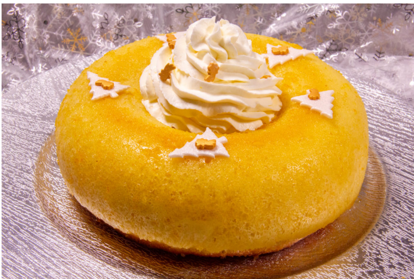
Baba de Noël (recette Thermomix)

Cette année on sort un peu des codes en réalisant un magnifique et savoureux baba qui va remplacer avec beaucoup d'élégance la traditionnelle bûche. Réalisez-le simplement et facilement avec votre Thermomix!