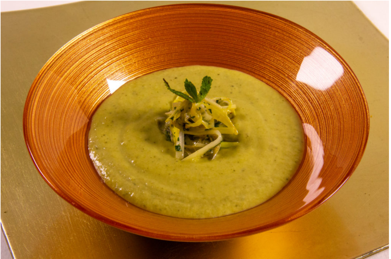
Soupe Poireaux Menthe (Thermomix)