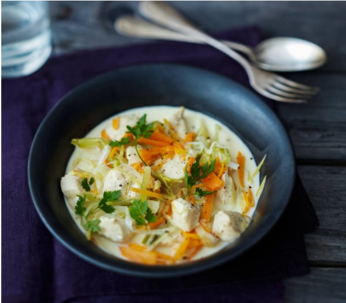
Waterzooi de poulet (recette vidéo au Thermomix)