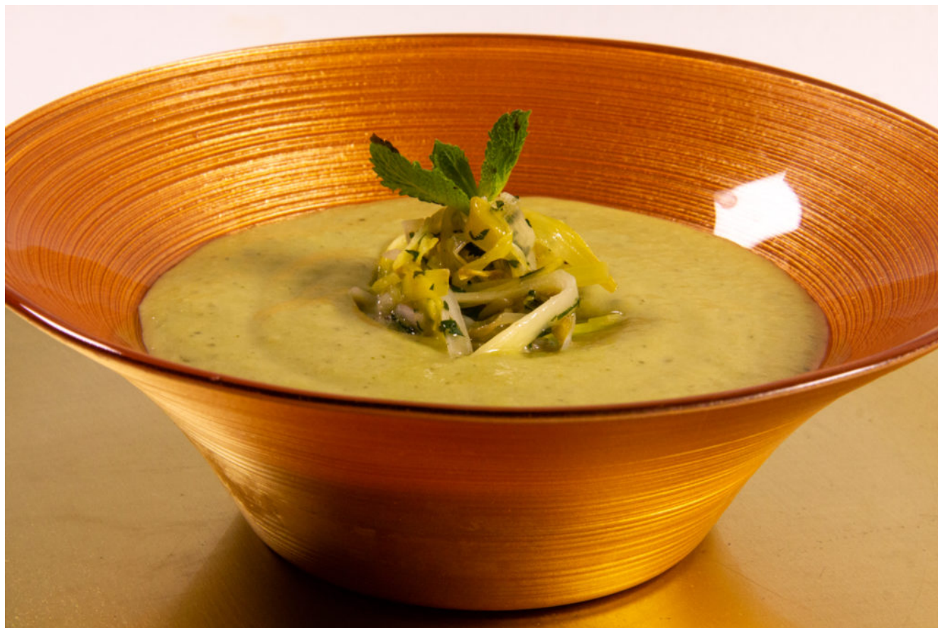
Soupe Poireaux Menthe (Thermomix)

Vous ne connaissez pas encore le Thermomix®, ce robot ménager le plus vendu en Europe et que tout le monde rêve d'avoir dans sa cuisine?