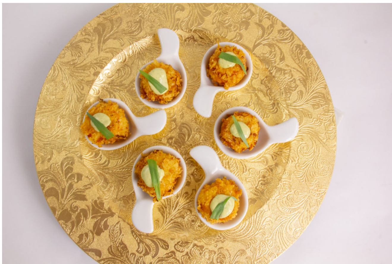
Cromesquis de crevette, mayonnaise estragon

Cette recette se commence la veille ou quelques jours avant puisque vous devrez congeler les cromesquis avant de les frire.