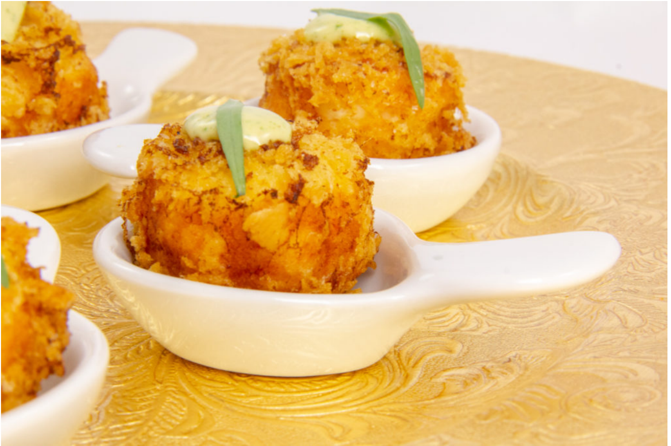
Cromequis de crevette, mayonnaise estragon