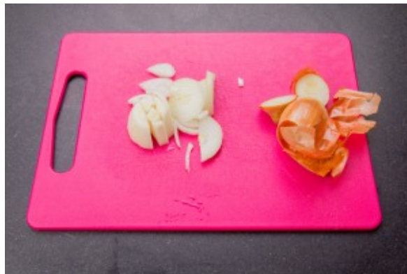
Épluchez et coupez l'oignon.