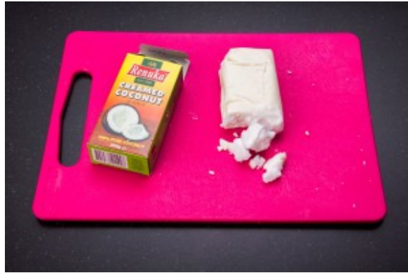
la crème de coco