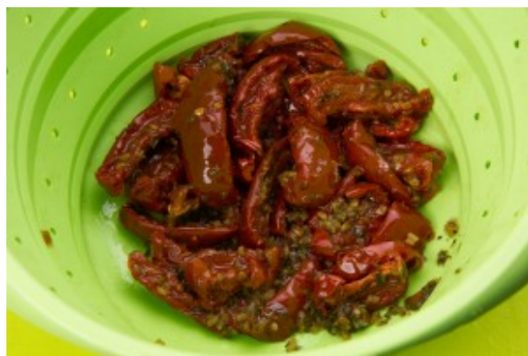
Égouttez les tomates séchées