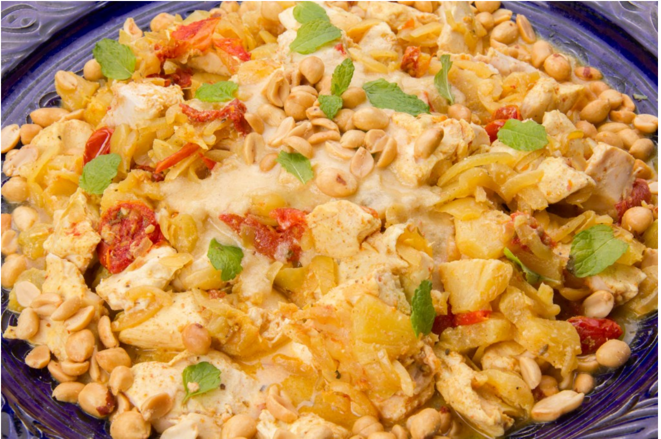
Curry de poulet moelleux basse température