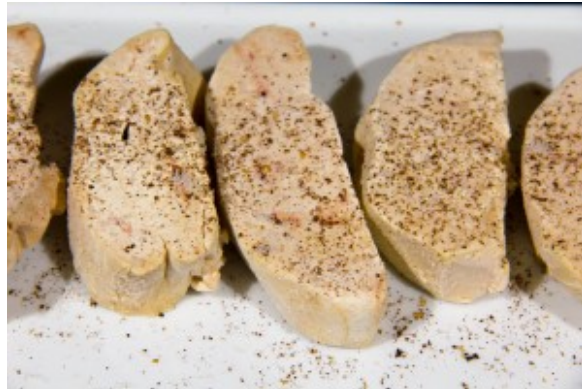
Salez et poivrez les tranches de foie gras