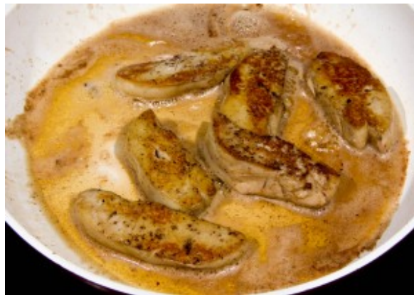
Poêlez les tranches de foie gras 2 mn de chaque côté

Pendant ce temps procédez au dressage de l'assiette: