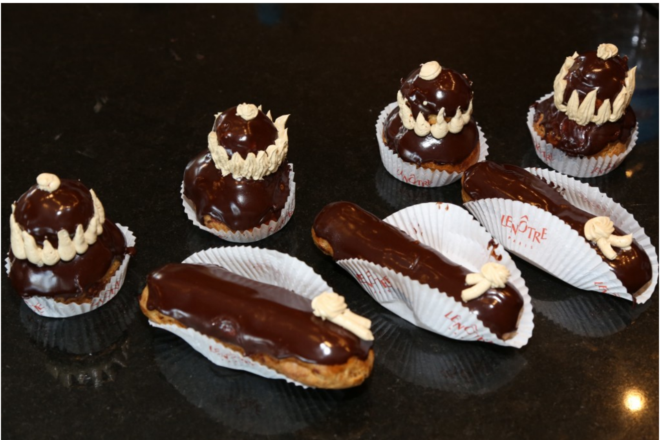
Chouquettes, éclairs et religieuses au chocolat

Depuis son succès ne s'est jamais démenti au point que de nombreux chefs pâtisseries de renom comme Christophe Adam ou Philippe Conticini arrivent encore à les magnifier avec de nouvelles et sublimes créations.