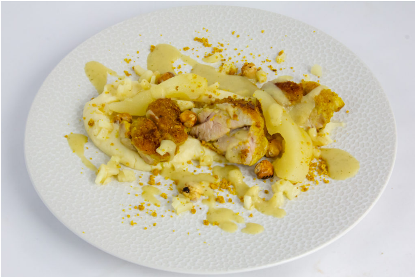
Ris de veau, poire, céleri