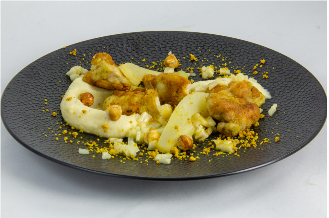
Ris de veau, poire, céleri