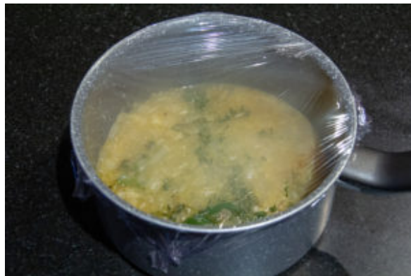
Ôtez du feu et filmez la casserole