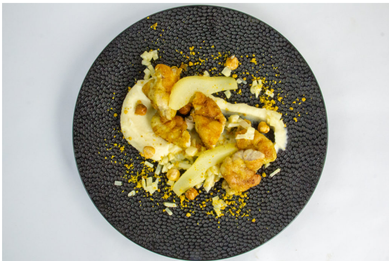
Ris de veau, poire, céleri

Si vous aimez les ris de veau, vous allez vous régaler! Grâce à la basse température vos ris seront parfaitement cuits, tendres à cœur. La recette se commence la veille car il faut blanchir les ris de veau et les faire reposer pendant 12 heures au frais. J'ai accompagné ces ris de veau avec une sauce tout en légèreté, réalisée avec de l'oignon et de la poire. Voici donc mes Ris de veau, céleri et poires, à la fois croustillants et tout en douceur.