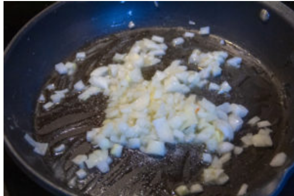
Faites revenir l'oignon