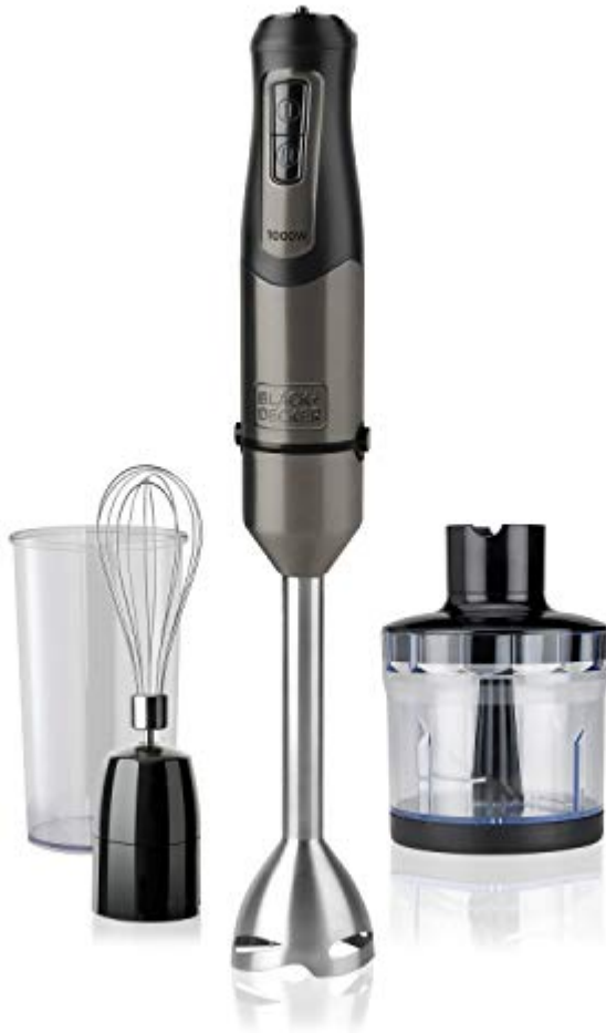
Black + Decker BXHBA1000E Mixeur Plongeant, Acier inoxydable, Noir