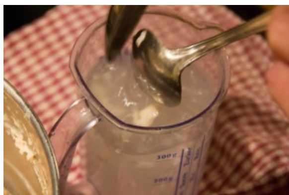
Rincez les cuillères