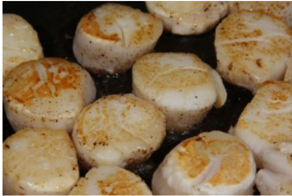
Poêlez les saint Jacques