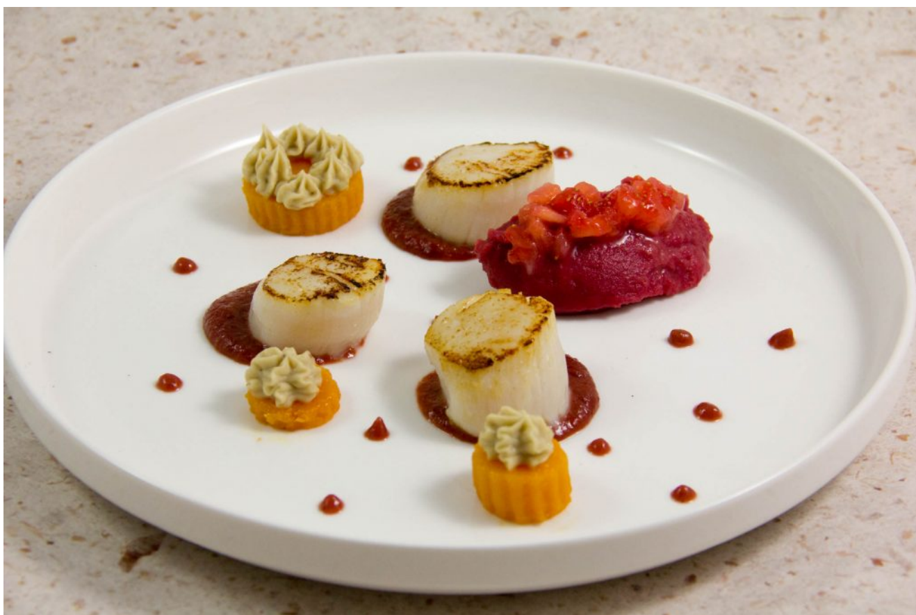
Saint Jacques en habit rose, petits légumes d'hiver

Aujourd'hui voici une recette qui m'a été inspirée par un plat de Saint Jacques, châtaigne et courge confite servi dans le restaurant du chef Georges Blanc. Je dis bien inspirée car si la présentation s'en rapproche grandement, la réalisation en est différente car je ne connais pas les secrets de sa recette... Celles du chef étaient un vrai régal mais je dois dire que mon interprétation de Saint Jacques en habit rose, petits légumes d'hiver a remporté un vif succès à la maison. La fraise se marie intimement avec la betterave et réveille avec brio la douceur des Saint Jacques. Alors régalez-vous!