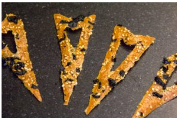
Les crackers aux algues et sésame...