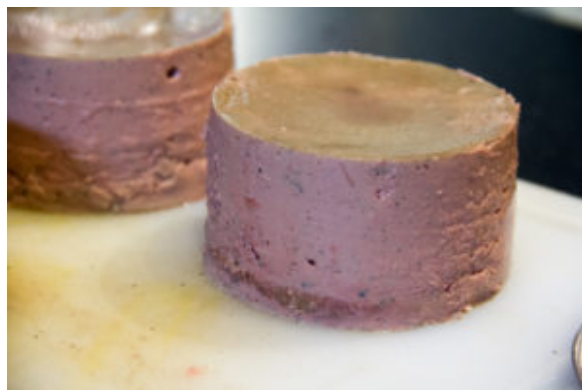
Décerclez en poussant doucement côté pain