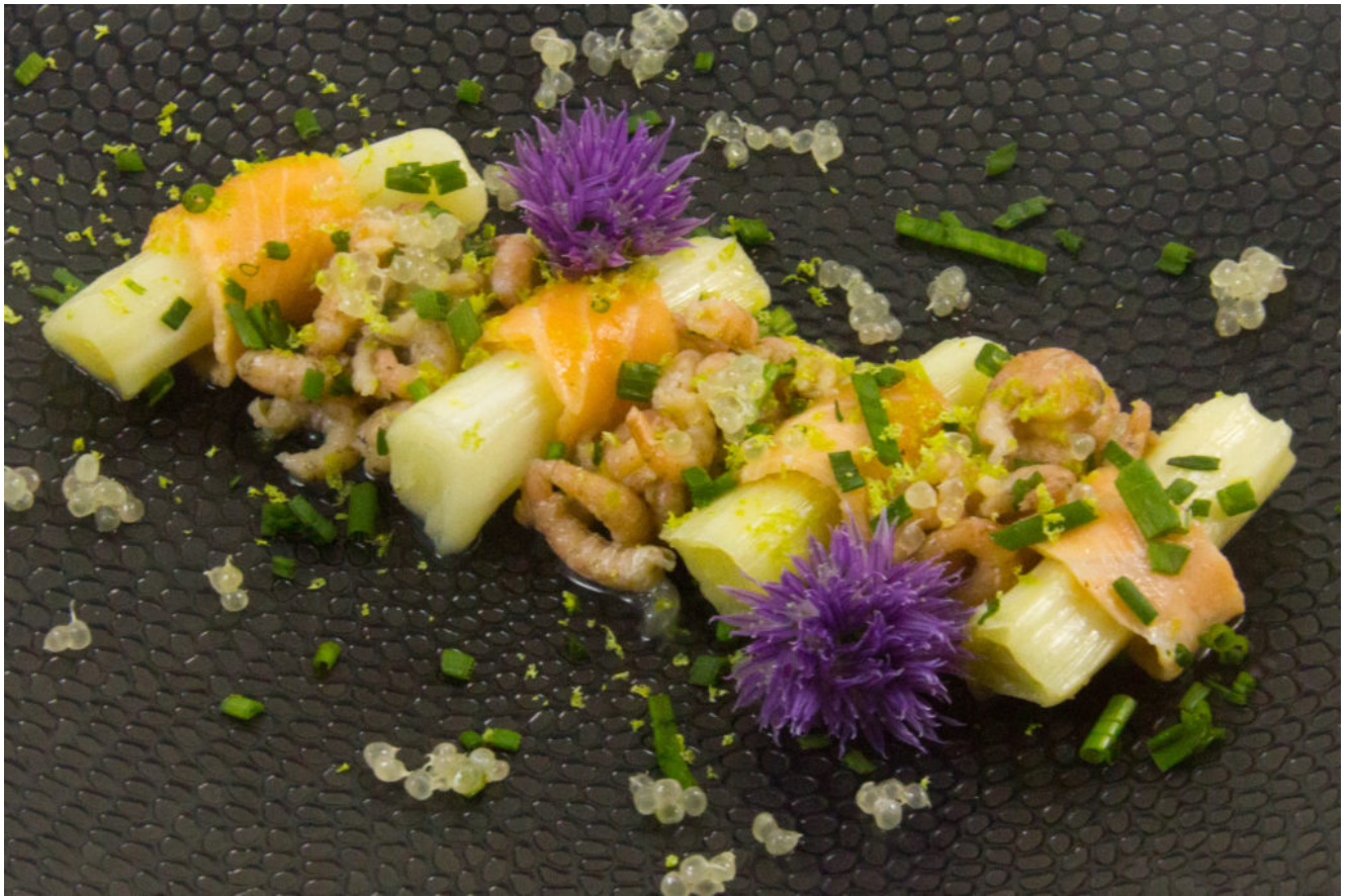
Salade de poireaux basse température, saumon mariné et crevettes grises acidulées