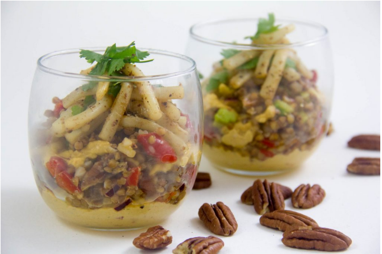
Salade dynamisante au sarrasin et blancs de seiche