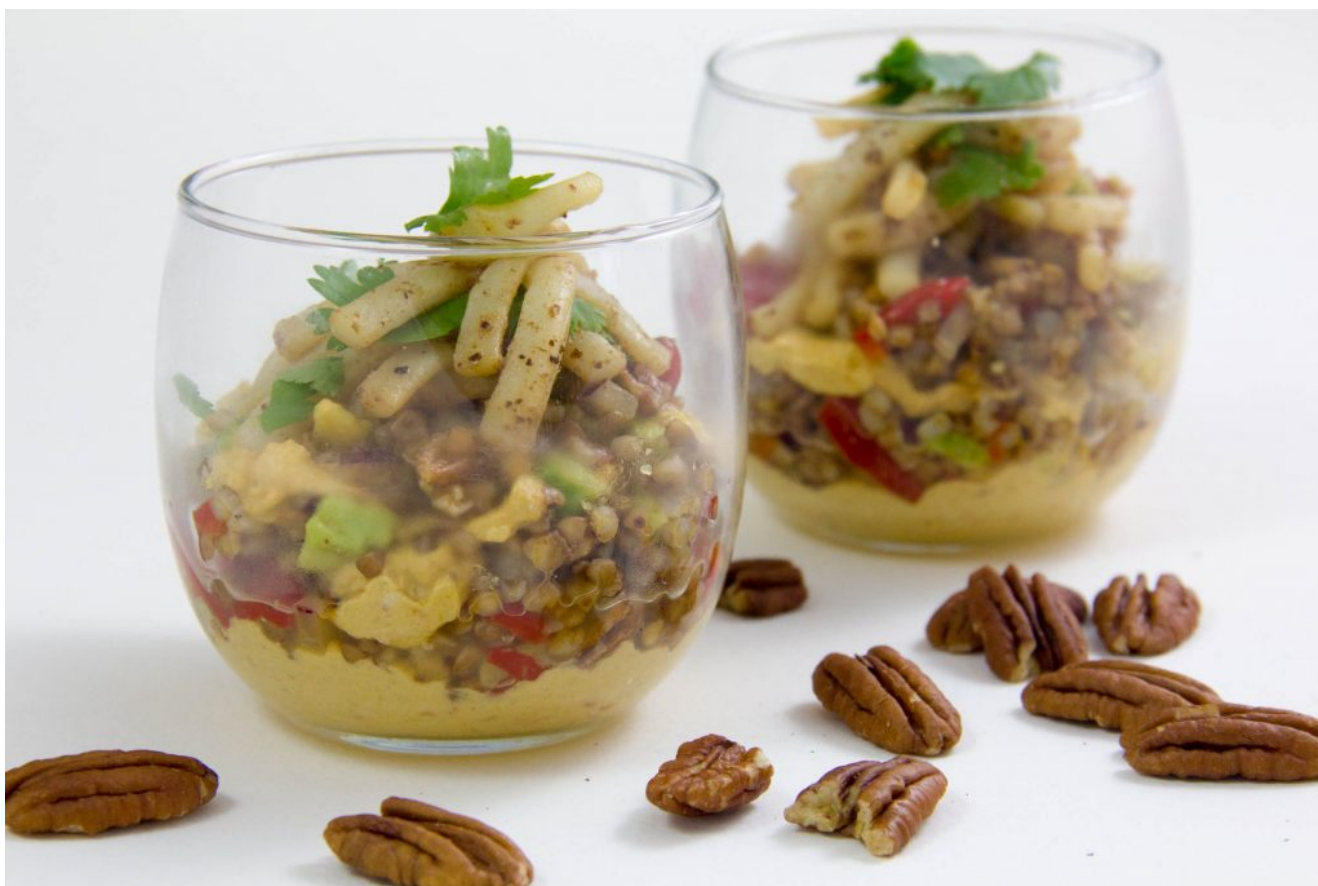
Salade dynamisante au sarrasin et blancs de seiche