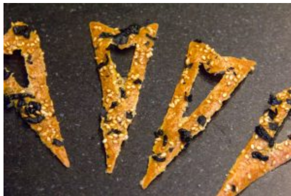
Les crackers aux algues et sésame...