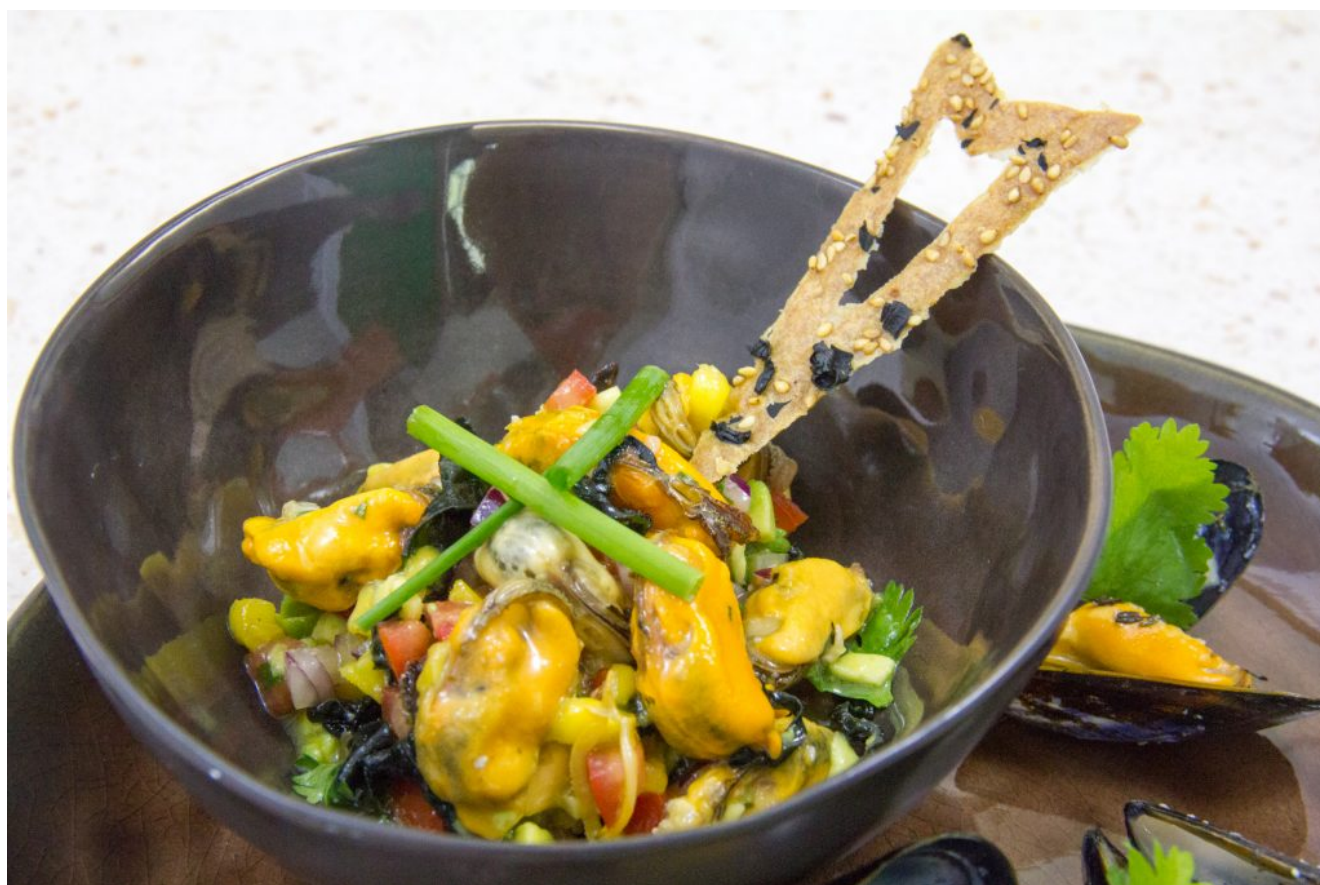
Salade fruitée de moules multicolore, crackers aux algues

C'est la bonne saison pour profiter des moules de bouchot. On les prépare le plus souvent marinières mais il existe beaucoup d'autres manières de les préparer! Je vous les propose aujourd'hui en salade ultra rafraîchissante pleine de saveurs.