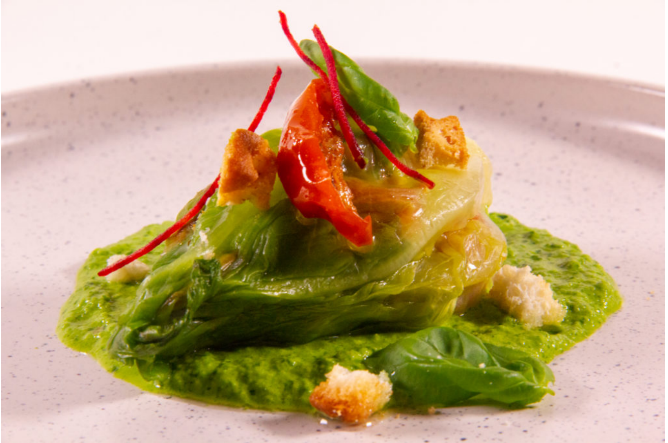
Salade Glenn Viele (recette sous vide sans cuisson)