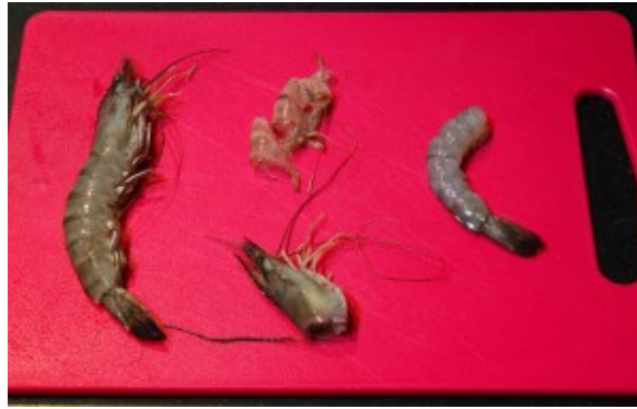
Décortiquez les gambas

Attention: enlevez la tête des gambas en prenant soin d'ôter en même temps le petit boyau. Pincez la tête entre vos doigts et tirez doucement; le petit boyau vient avec la tête.