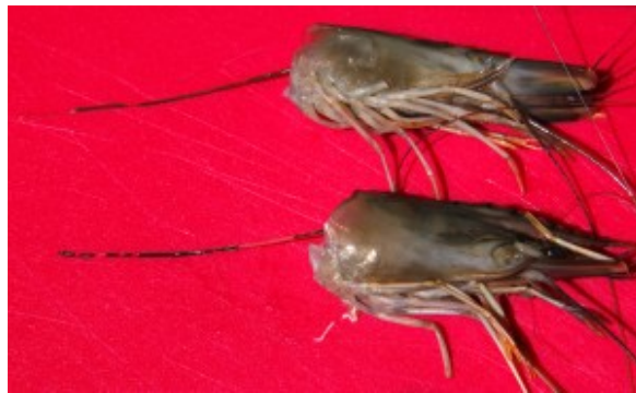
Tête et petit boyau

Attention: enlevez la tête des gambas en prenant soin d'ôter en même temps le petit boyau. Pincez la tête entre vos doigts et tirez doucement; le petit boyau vient avec la tête.