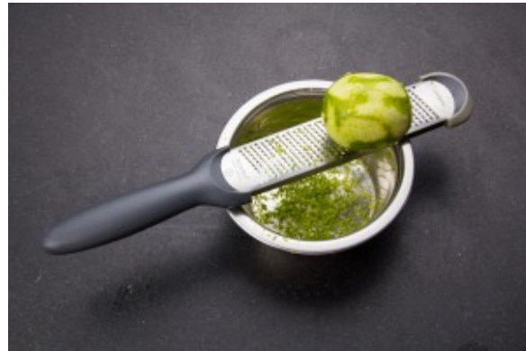
Zestez les citrons verts