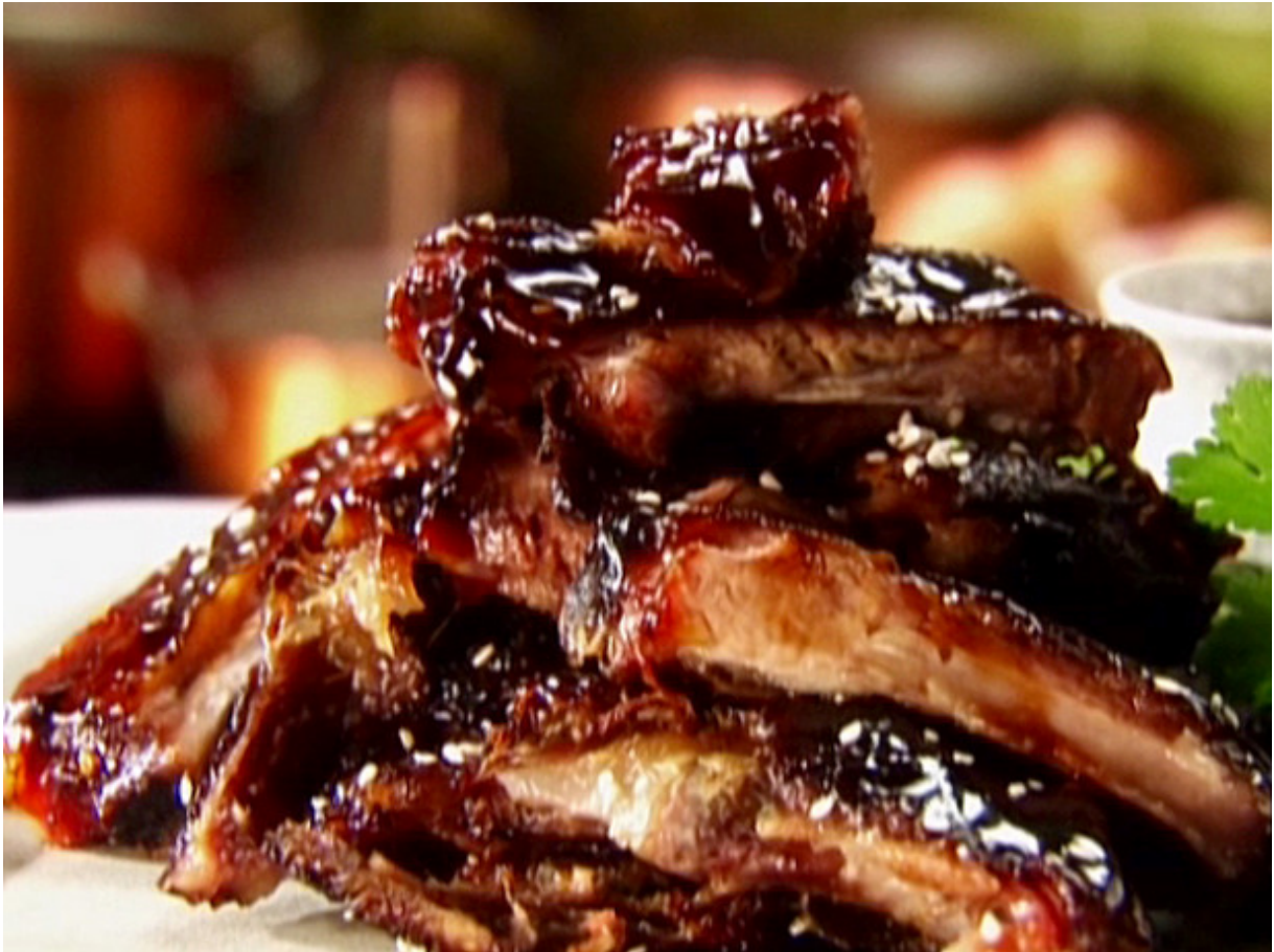
Spare Ribs basse température