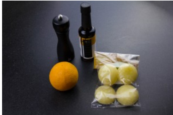
Ingrédients de la Sauce à l'orange