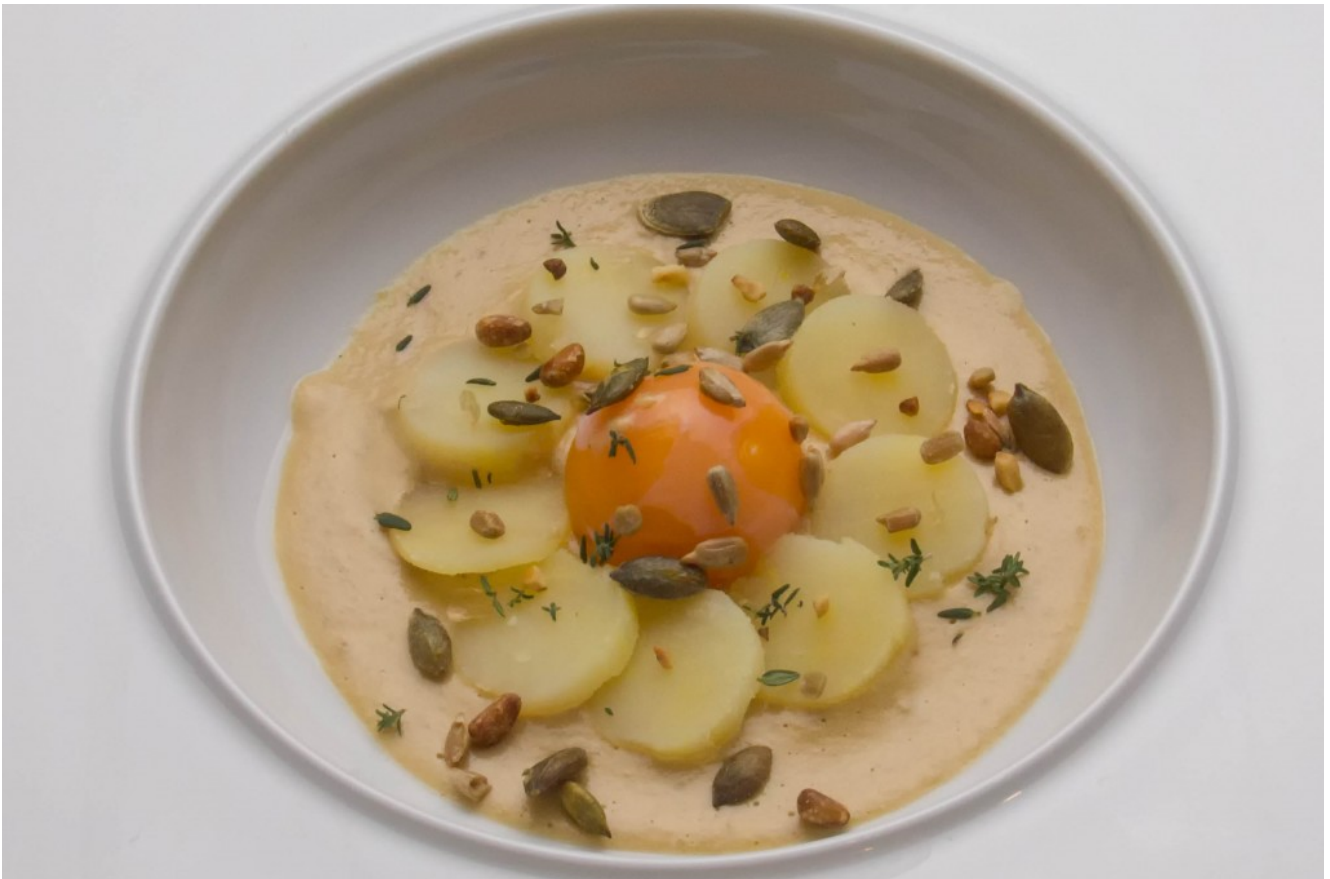
Jaune d'œuf crémeux au foie gras, pommes de terre basse

Vous y retrouverez mes recettes phares en pas à pas imagées comme dans le blog.