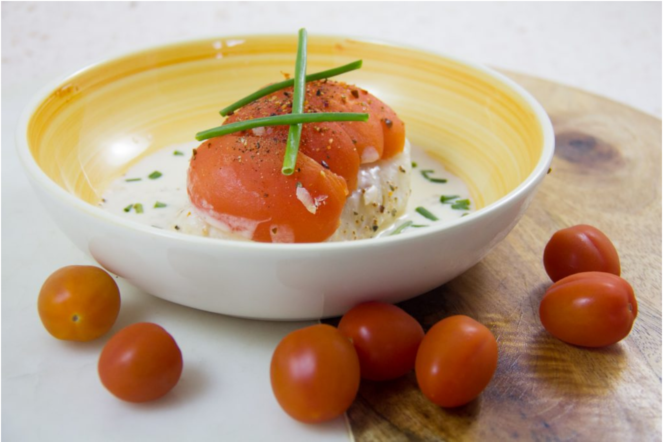
Dos de Skrei aux tomates, sauce crémeuse à l'échalote