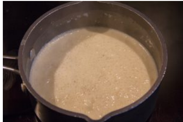
Rôti porc basse température