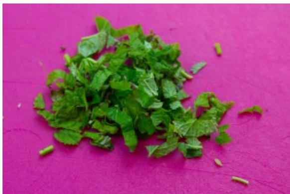
Ciselez la mélisse