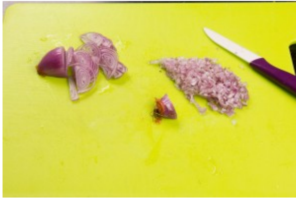
Ciselez les échalottes