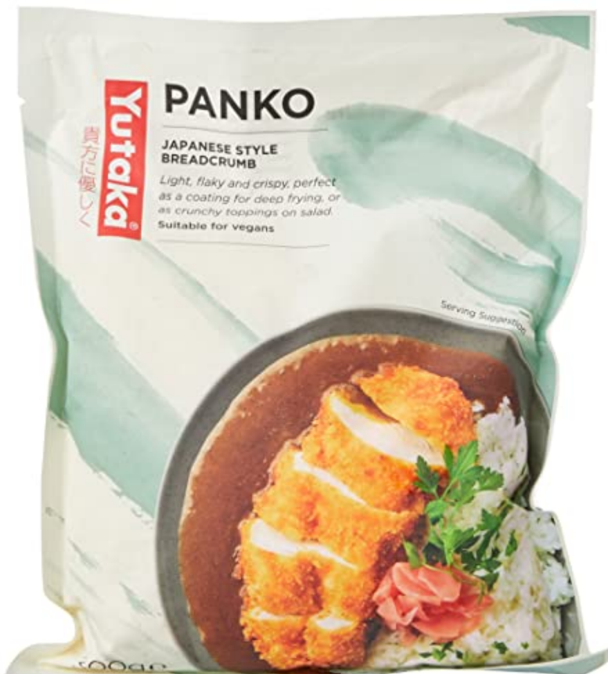
Yutaka chapelure panko 300 g