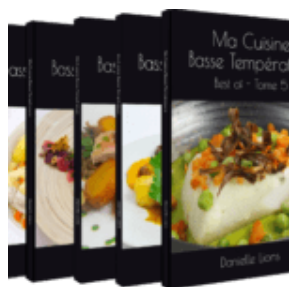
Tomes 1, 2, 3, 4, 5

Beaucoup d'entre vous aviez émis le souhait d'être informés de la parution de mes meilleures recettes basse température.