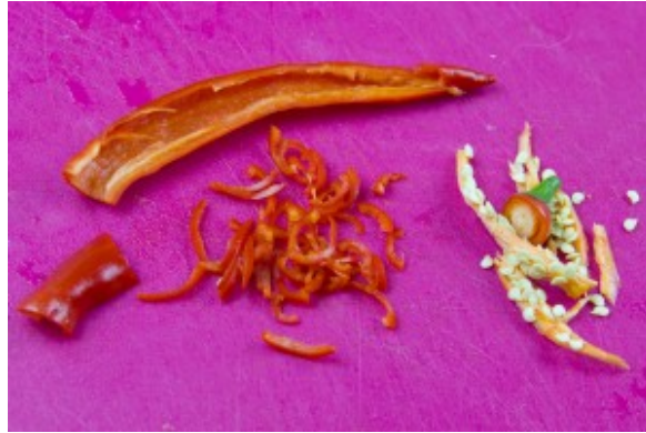
Coupez le piment