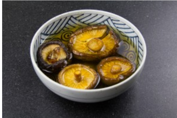
Réhydratez les shitakés

Pendant ce temps préparez la sauce teriyaki (vous pouvez la préparer la veille et la réchauffer juste avant de servir)