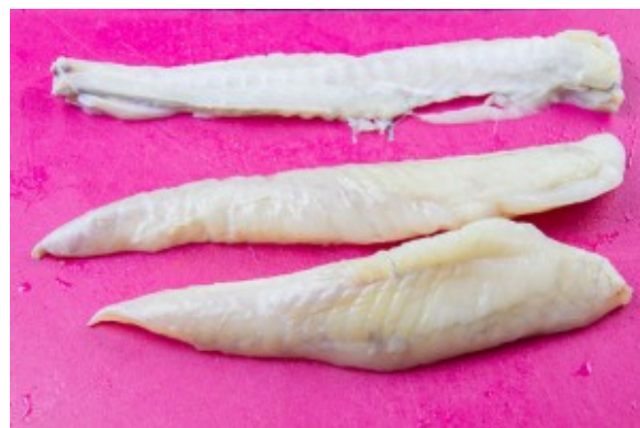
Séparez les filets de l'arête centrale

La préparation et cuisson de la lotte: c'est un poisson qui n'a pas d'arrêtes mais une sorte de colonne vertébrale. Il est donc facile de lever les filets en passant votre couteau de chaque côté de cette arête dorsale.