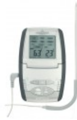
thermometre sonde-de- cuisson