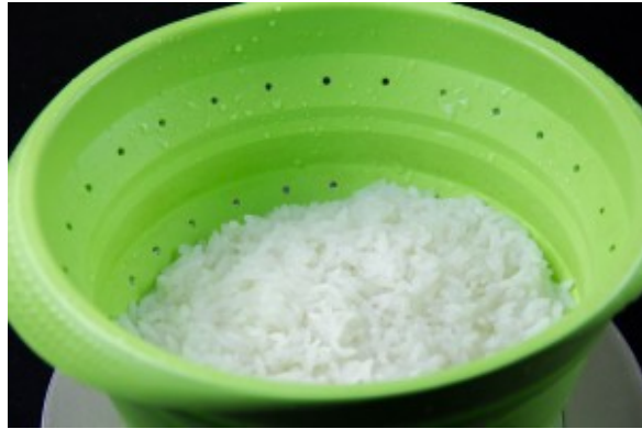
Cuire et égoutter le riz