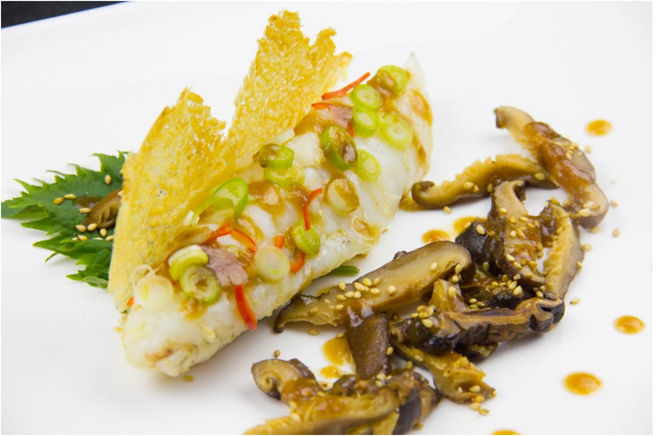
Lotte au gingembre, shitakés et sauce terriyaki ananas, chips de riz