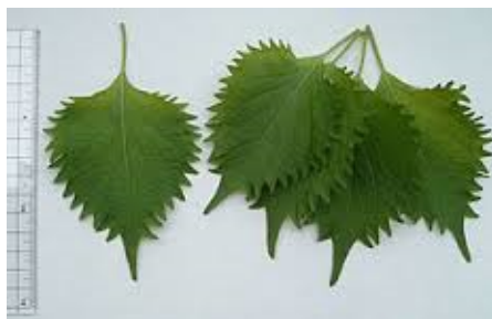
feuilles de shiso vert