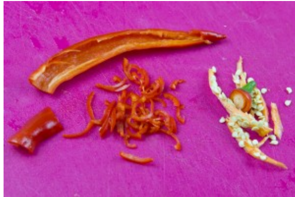
Coupez le piment

elles qui sont très piquantes. Comme les cébettes coupez le piment en fines lamelles. Réservez.