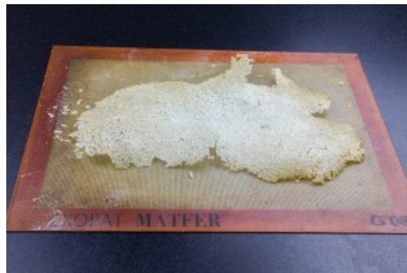
Chips à la sortie du four

La préparation et cuisson de la lotte: c'est un poisson qui n'a pas d'arrêtes mais une sorte de colonne vertébrale. Il est donc facile de lever les filets en passant votre couteau de chaque côté de cette arête dorsale.