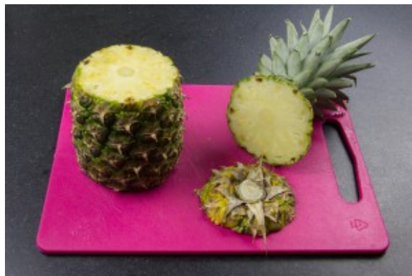
Coupez les deux extrémités de l'ananas