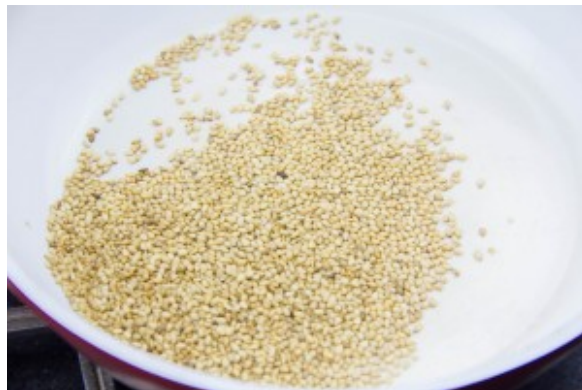
Torréfiez les graines de sésame