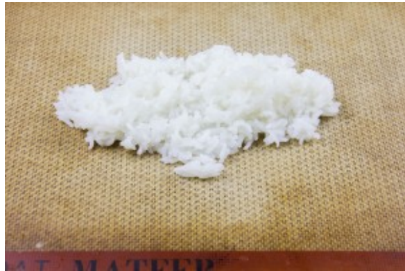
Déposez le riz sur une feuille de papier cuisson