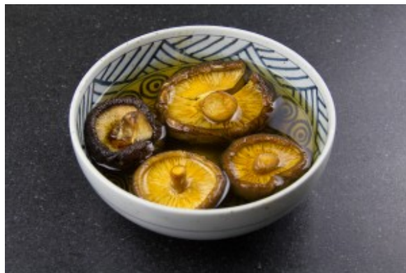
Réhydratez les shitakés

Pendant ce temps préparez la sauce teriyaki (vous pouvez la préparer la veille et la réchauffer juste avant de servir)