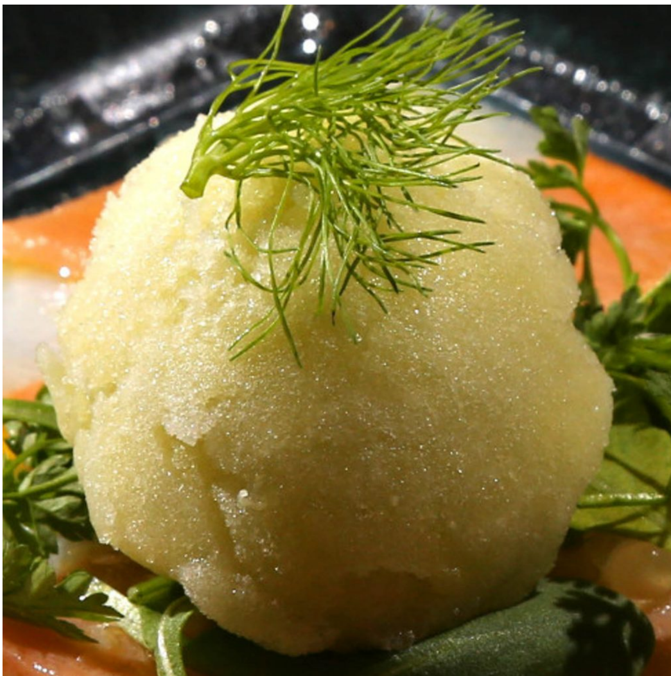
Sorbet surprenant au fenouil

Voici un très parfumé et étonnant sorbet au fenouil qui se marie parfaitement en été avec une salade de tomate, un carpaccio ou un tartare qu'il soit de viande ou de poisson... La préparation de cette recette se fait la veille en raison du passage en congélation.