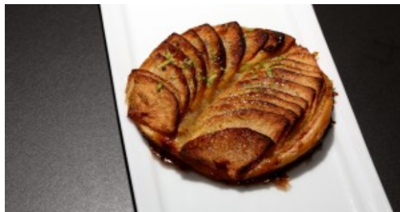
Tarte fine aux pommes

Vous trouverez ici la recette de cette fabuleuse tarte fine aux pommes.