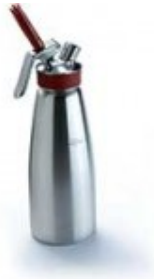
syphon gourmet whip ISI