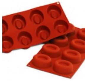
moule en silicone à savarin