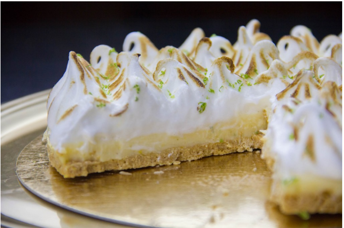
Tarte au citron

Essayez-la , vous allez vous régaler et étonner vos invités par sa présentation!