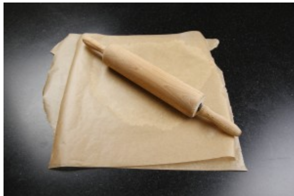
Étalez avec une rouleau à pâtisserie