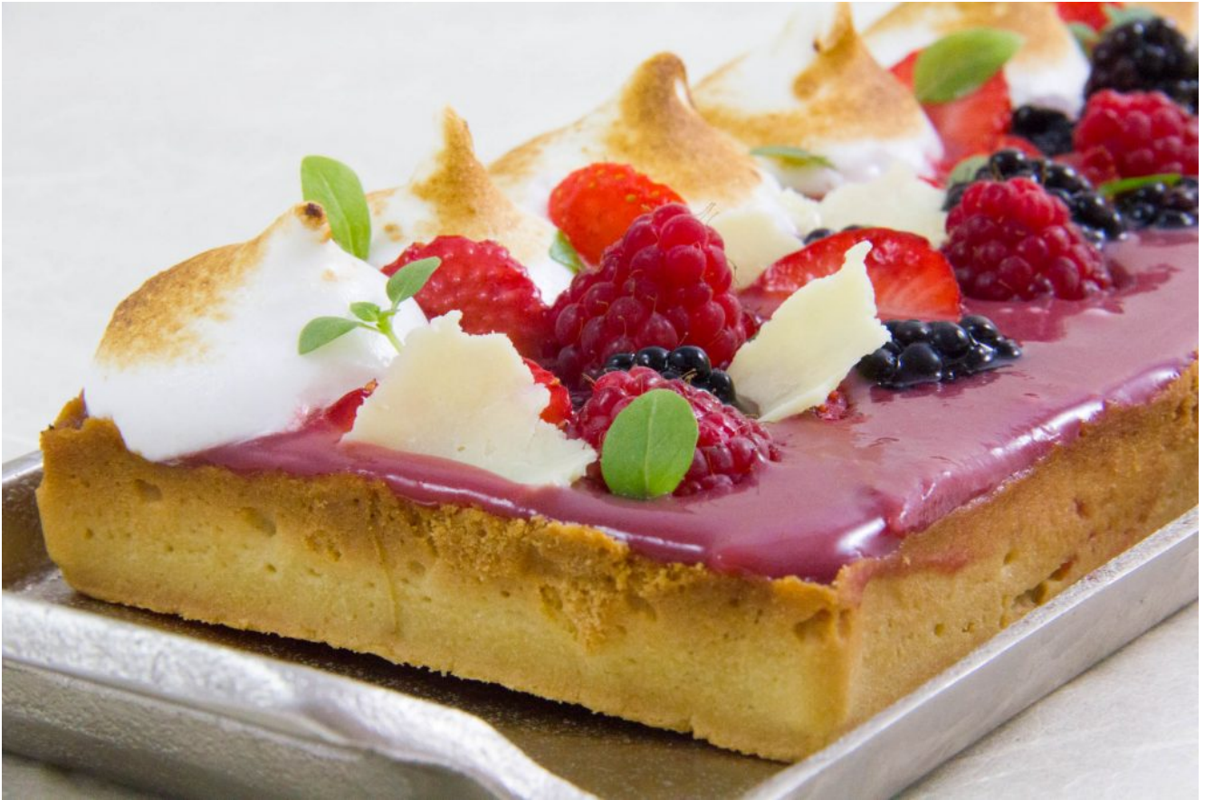
Ma tarte crémeuse meringuée aux framboises et ses fruits rouges