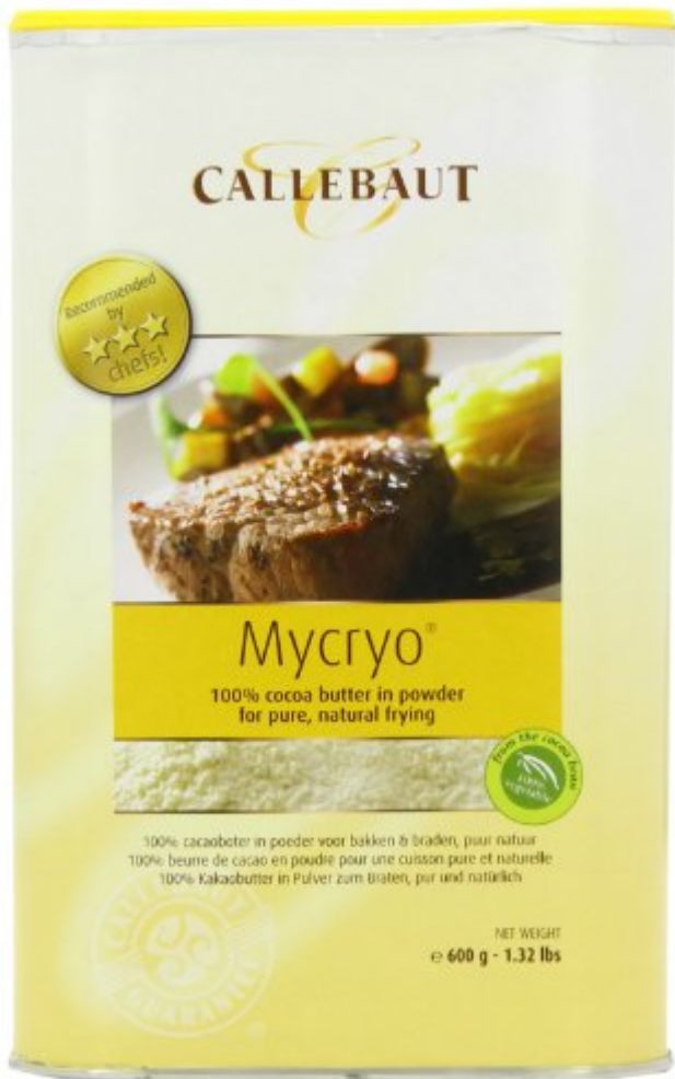
Poudre de beurre de cacao Callebaut Mycryo 600 g

Pour le crémeux framboise : je vous rappelle les ingrédients du crémeux et retrouvez sa recette en pas à pas en cliquant ici .