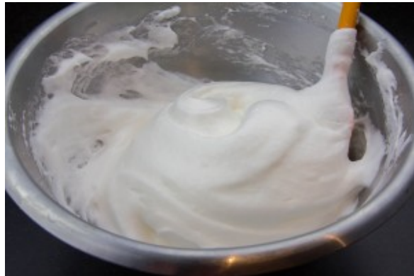
Montez les blancs au fouet