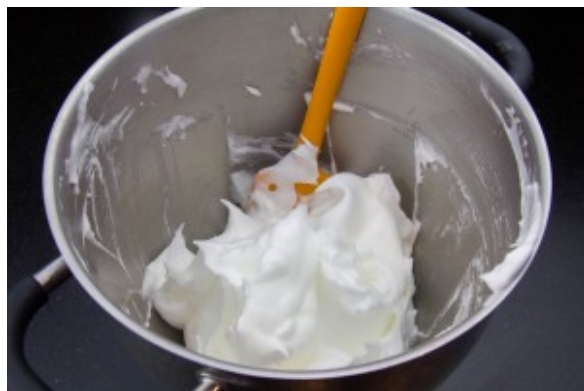
Ajoutez ensuite délicatement le sucre glace tamisé