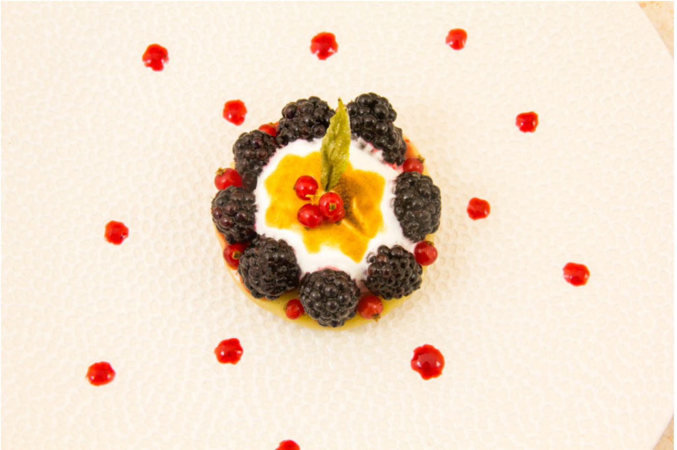
Tartelettes aux mures, parfum verveine et rhubarbe