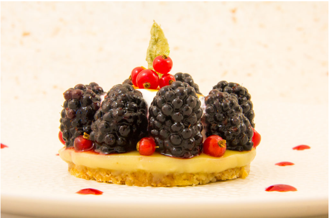
Tartelettes aux mures, parfum verveine et rhubarbe