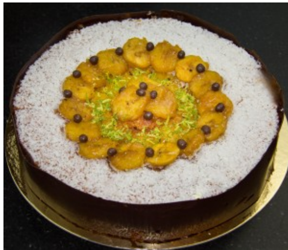
Bourdaloue à l'ananas

Comme beaucoup d'entre vous, je regarde « Le meilleur Pâtissier » avec Mercotte et Cyril Lignac. Dans la prochaine émission, une des épreuves portera sur les gâteaux aux fruits et en particulier une Bourdaloue à l'ananas. Je n'en ai pas la recette mais je me suis fait un plaisir que d'en imaginer une... Un sablé bien croustillant et caramélisé, une crème de noix de coco onctueuse et agrémentée de petits dés d'ananas acidulés, une jolie présentation... Et le résultat est délicieux! Voici donc ma version de la Bourdaloue à l'ananas.