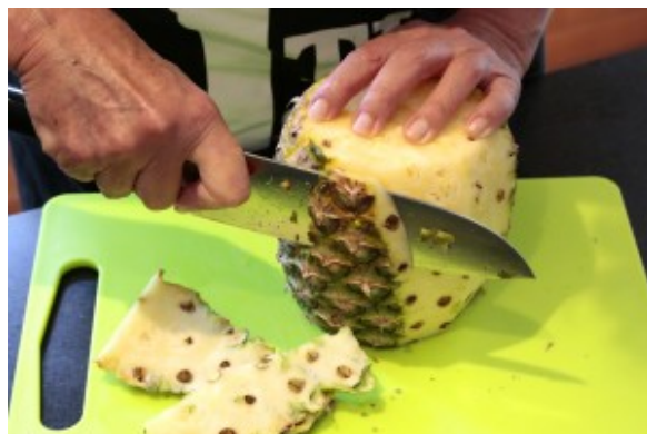
Coupez les cotés de l'ananas