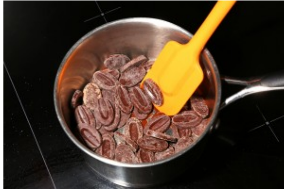
Faire fondre le chocolat