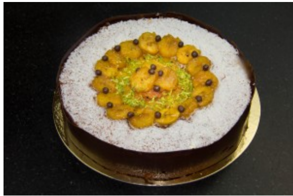
Bourdaloue à l'ananas

décollée, posez la délicatement parallèlement sur le côté du gâteau qui, je le rappelle, doit être bien froid: faites en sorte de commencer par la caler sur le rebord du support pour bien être toujours à la même hauteur en tournant autour du gâteau. C'est un peu technique mais au bout de deux ou trois fois vous aurez pris le coup! Remettez le gâteau au congélateur pour 15 mn et ôter la bande avec délicatesse. Et voici votre magnifique et délicieuse Bourdaloue à l'ananas!